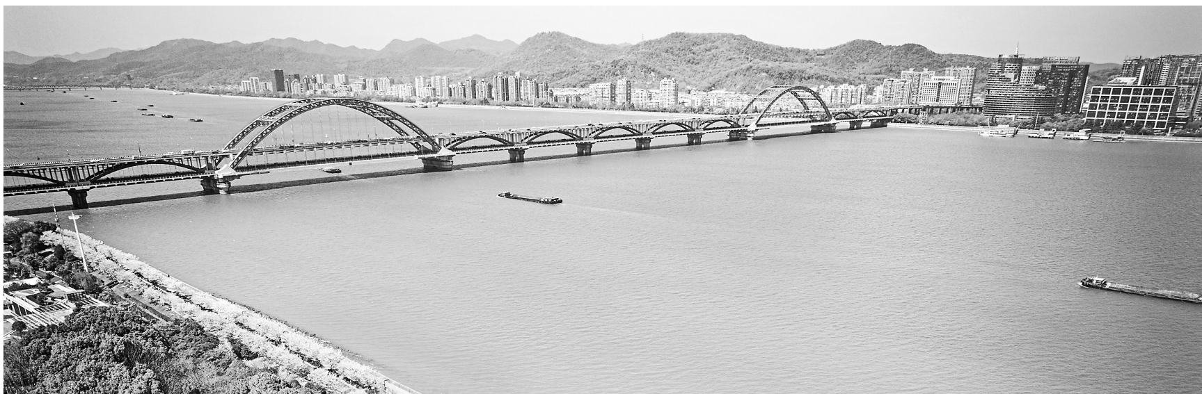
图为近日拍摄的杭州市滨江区沿江绿道“樱花跑道”。