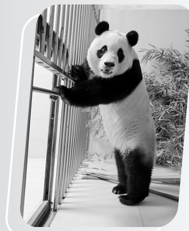
在中国大熊猫保护研究中心神树坪基地拍摄的已经入住隔离检疫圈舍的大熊猫“福宝”。(资料图)