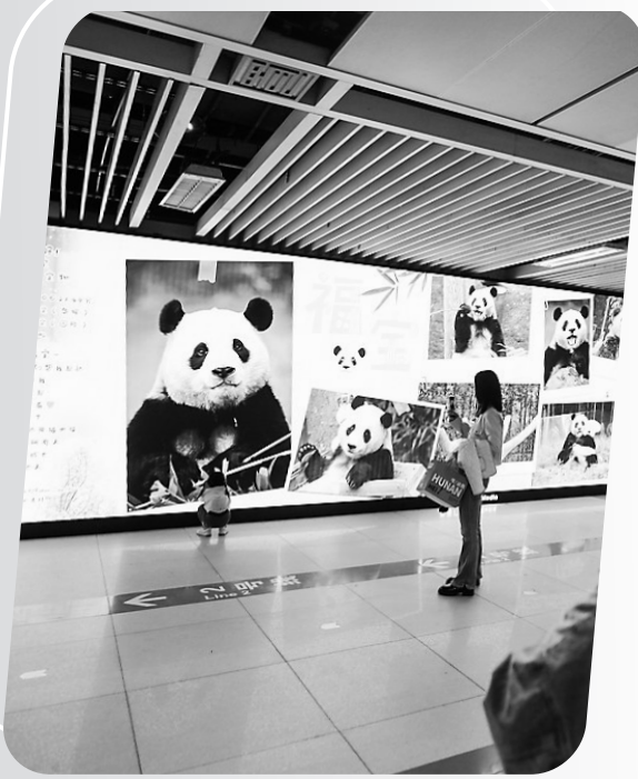
市民在成都春熙路地铁站内拍摄大熊猫。(资料图)