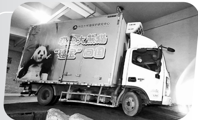
旅韩大熊猫“福宝”搭乘包机抵达成都双流国际机场。(资料图)