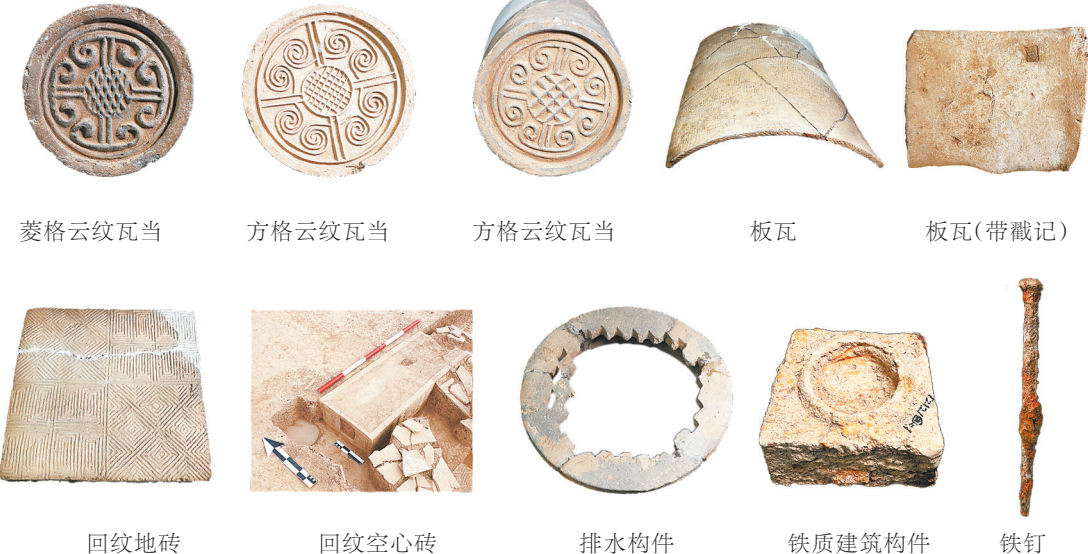
菱格云纹瓦当 方格云纹瓦当 方格云纹瓦当 板瓦 板瓦(带戳记) 回纹地砖 回纹空心砖 排水构件 铁质建筑构件 铁钉