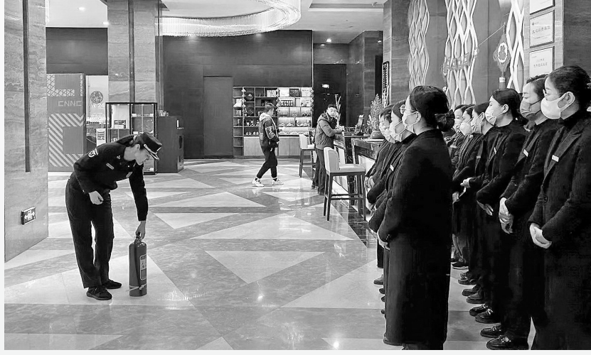
麦积区天水地质宾馆组织员工开展消防技能培训,提高酒店消防安全管理水平。

天水麻辣烫火爆出圈后,来天水的游客持续呈井喷式增长。八方游客纷至沓来,天水的酒店也在清明假期迎来了入住高峰。