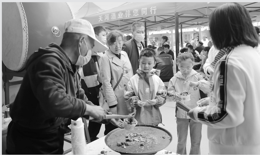
在天水市举办的甘肃麻辣烫及特色美食大PK活动中,地方特色美食受到游客青睐。