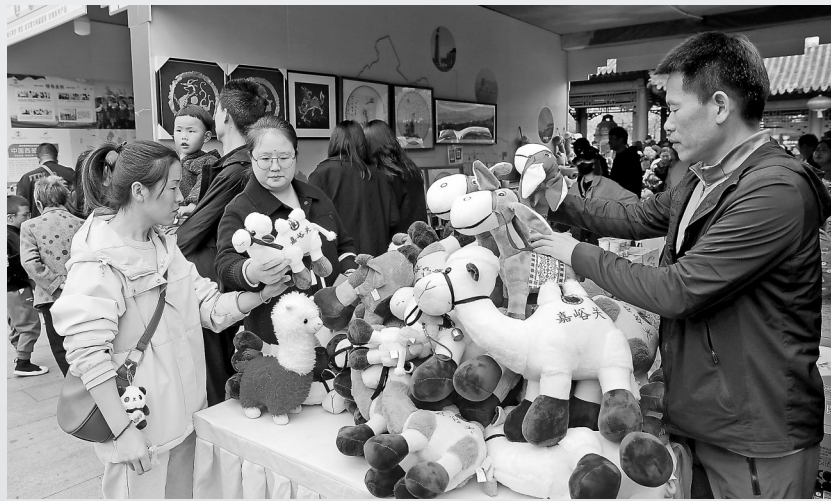
在天水市举办的甘肃文创非遗市集上,游客正在选购文创产品。