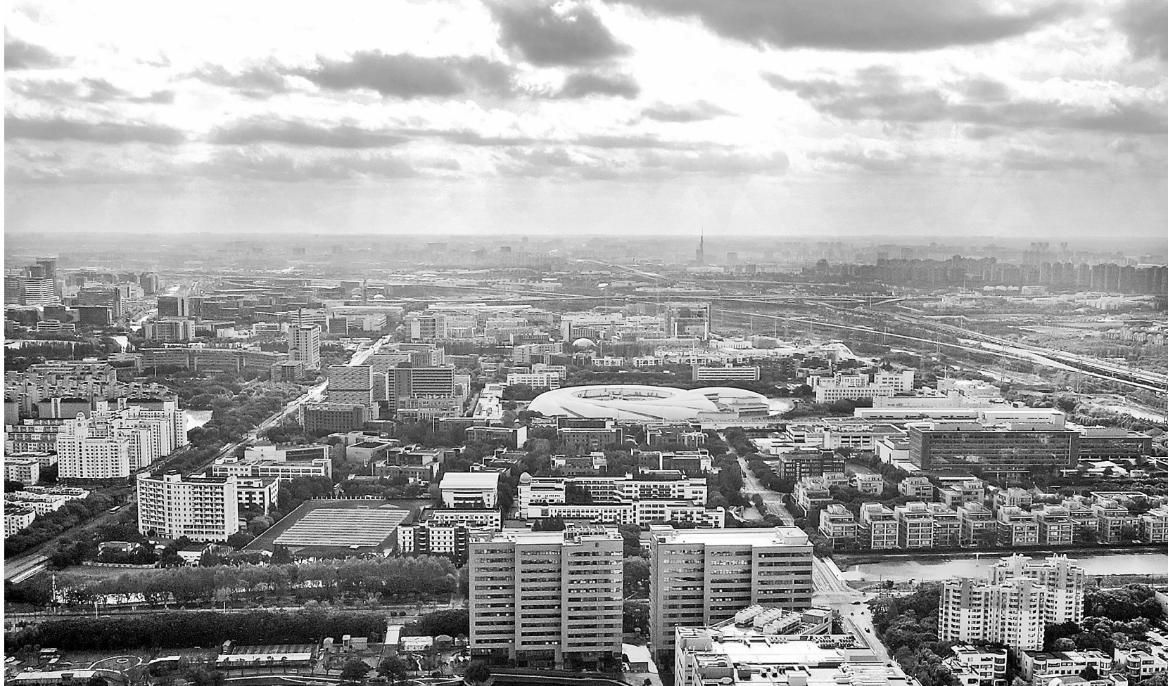
空中远望位于上海浦东新区张江科学城的形如“眼睛”的大科学装置上海光源(中)。