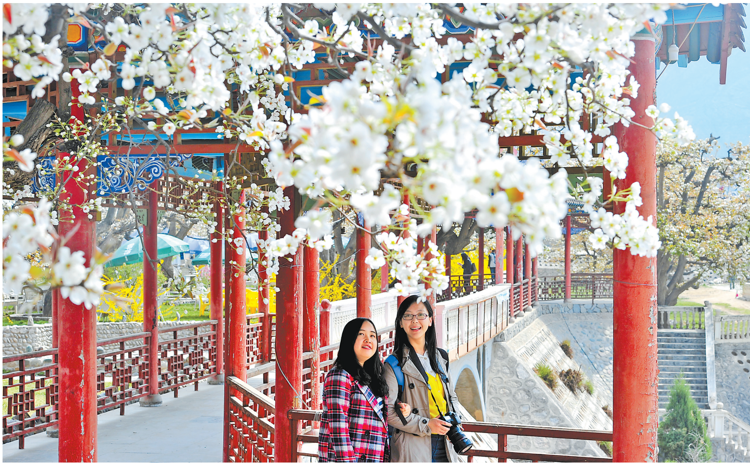
什川梨花 新甘肃·甘肃日报记者 郁婕

后，处处都沉浸在一袭纯白之中，雅到极致，净到极致。朋友告诉我，这里几乎家家种梨，以此为业，并乐此不疲。一般来说，梨树寿命就是几十年，而什川梨园的神奇之处就在于园中古梨树树龄最长的已超过300年，百年以上树龄的梨树尚存上万株。植物学家称之为“世界植物界的奇迹”，难得的“梨园博物馆”。