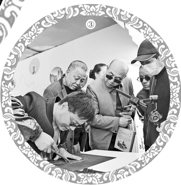
①天水市麦积区新阳镇绵延数里杏花竞相绽放,吸引众多游客观赏。 新甘肃·甘肃日报记者 高楠 丁凯 ②3月30日,在“甘肃麻辣烫及特色美食大PK”活动中,美食主播现场介绍特色美食。 新甘肃·甘肃日报记者 高楠 ③非遗传承人在文创非遗市集上展示“绝活”。 新甘肃·甘肃日报记者 丁凯