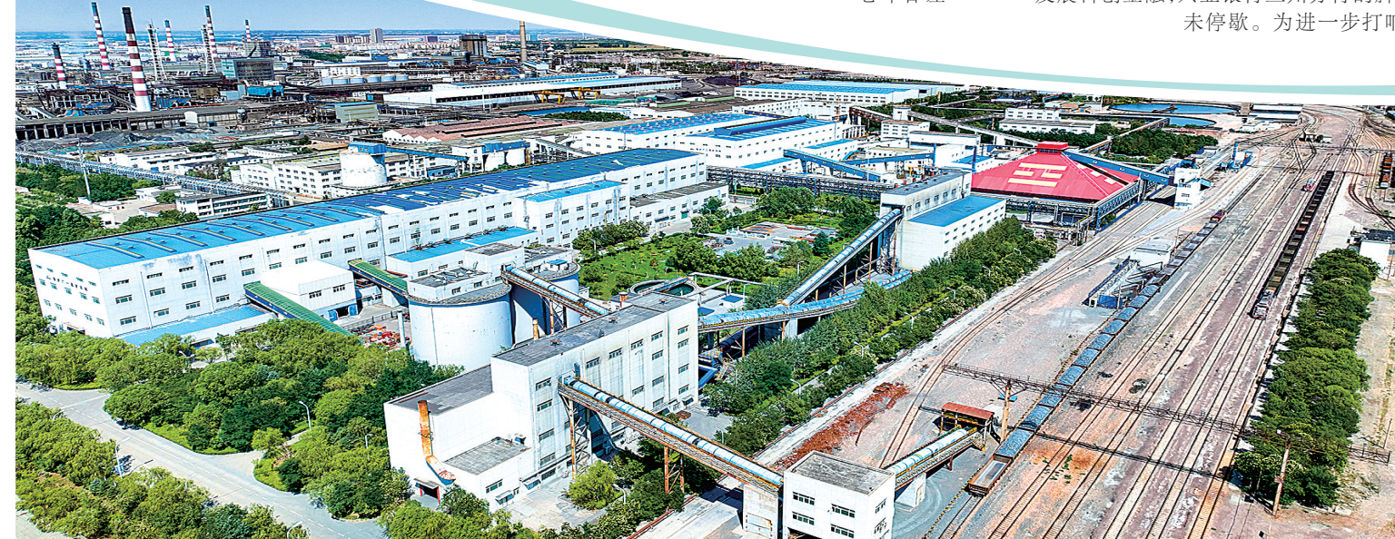
兴业银行兰州分行支持的金川集团。

又踏层峰辟新天,更扬云帆立潮头。立足新起点,兴业银行兰州分行将始终胸怀“国之大者”,聚焦“省之要者”,心系“民之向者”,化为“行之要务”,在总行党委的领导下,坚定不移走中国特色金融发展之路,切实攻克“难”的关口,不断夯实“稳”的大局,持续积累“进”的动力,实干笃行、奋楫争先,奋力谱写兴业银行兰州分行高质量发展新篇章,以金融“活水”为全面建设幸福美好甘肃蓄力赋能、添砖加瓦。(作者系兴业银行兰州分行党委书记、行长)