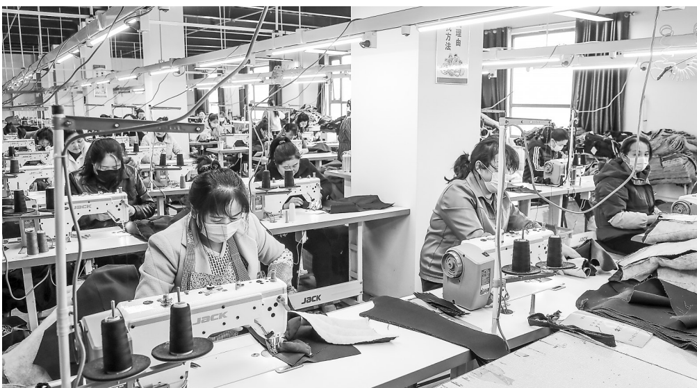
近日,位于庆阳市镇原县孟坝镇的庆阳准棉服饰有限公司,工人在制作服装。

揭牌仪式上,聘任了首批甘肃国际传播中心“海外传播官”“国际传播翻译官”。传播官分别来自俄罗斯、南非、土耳其、哈萨克斯坦、泰国等国家,由省内外教、留学生等组成;翻译官为兰州大学俄语、法语、西班牙语专业教师。他们将发挥文化交流桥梁纽带作用,加强海内外联络沟通,不断扩大甘肃“朋友圈”。