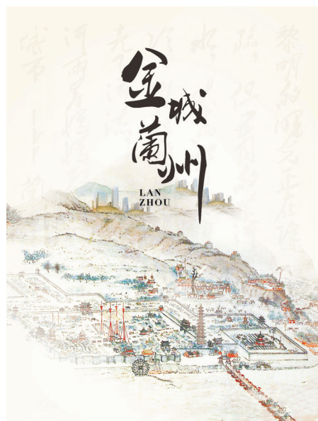
纪录片《金城兰州》海报