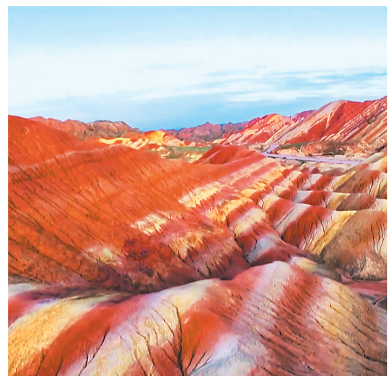
纪录片《航拍中国(第二季)》剧照·张掖七彩丹霞

纪录片《金城文物》详细挖掘兰州文物的价值和背后故事,全面反映兰州的厚重底蕴与文化温度,生动讲述了鲜活、灿烂的兰州故事。(本版编辑综合整理)