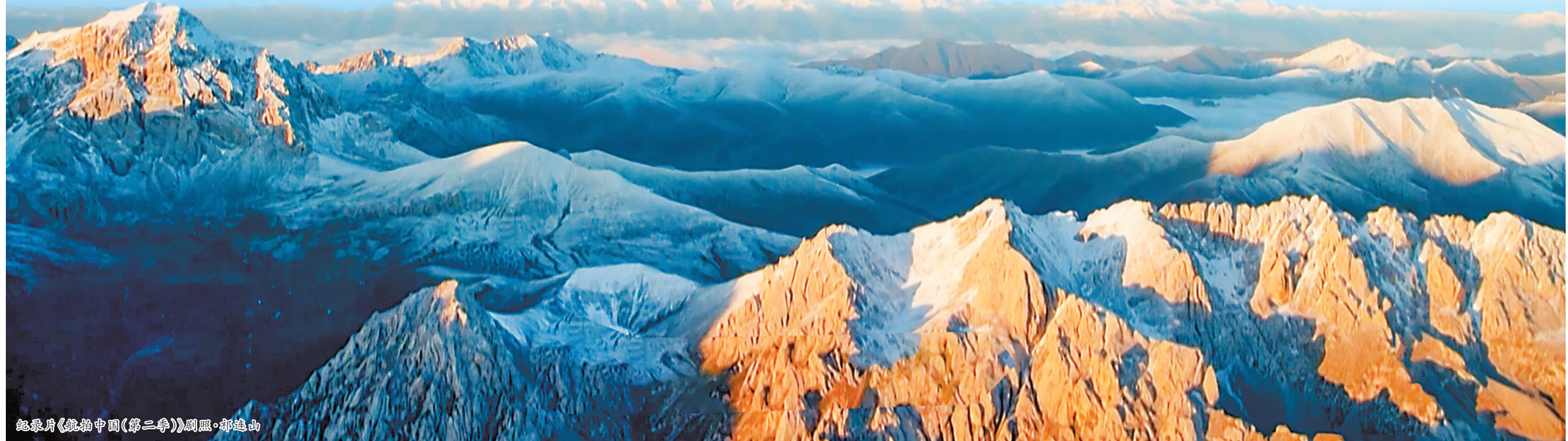
纪录片《航拍中国(第二季)》剧照·祁连山