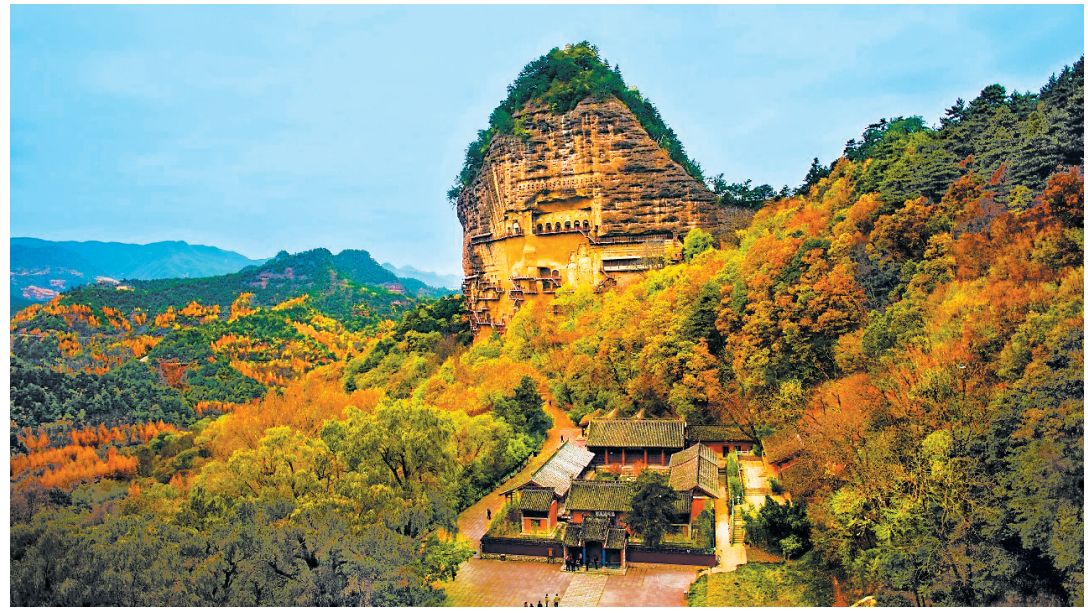
纪录片《中国石窟走廊》剧照·麦积山

的人物故事和丰富的情感张力将张掖民乐的历史过往、现实变化和美好愿景连接了起来,形成充满悬念和视听冲击的收视效果。