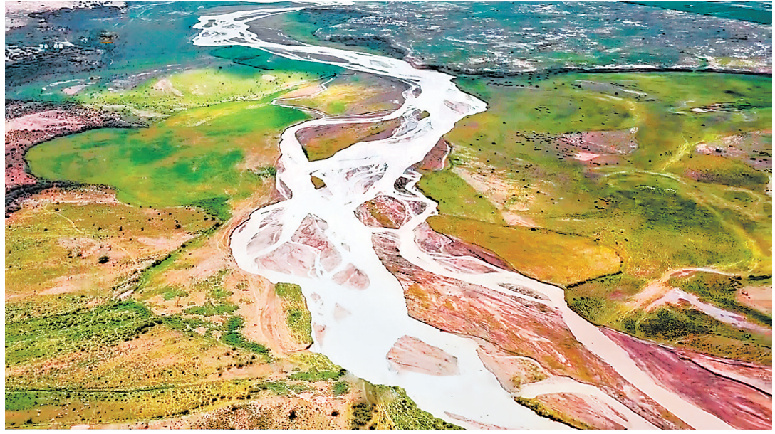
微纪录片《河西走廊——中国最伟大的走廊》剧照·疏勒河

在祁连山脉中段,有一个贯通南北的峰口——扁都口。纪录片《扁都口》以多线索、多人物共同推进的方法为结构主线,着力呈现扁都口的自然景观、险关要隘、历史故事、民俗风情、红色文化、生态建设、经济发展等,用鲜活