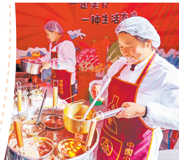
商家正在制作麻辣烫。