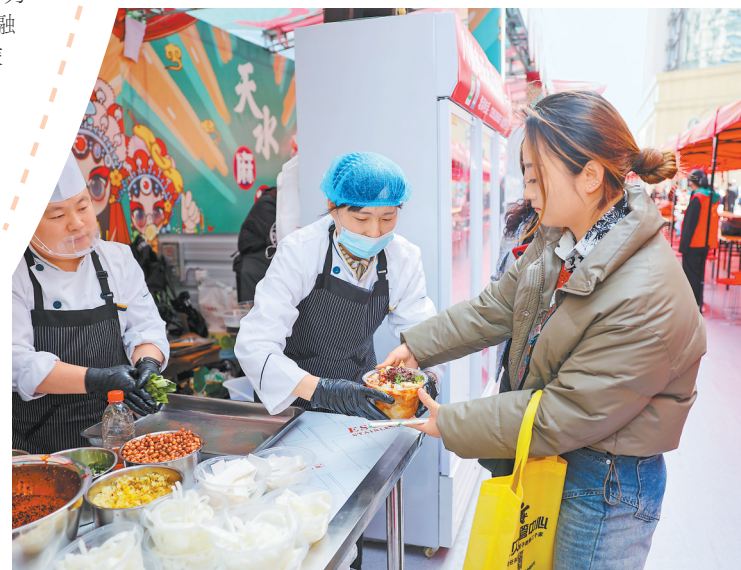
天水“麻辣烫一条街”吸引游客“打卡”。