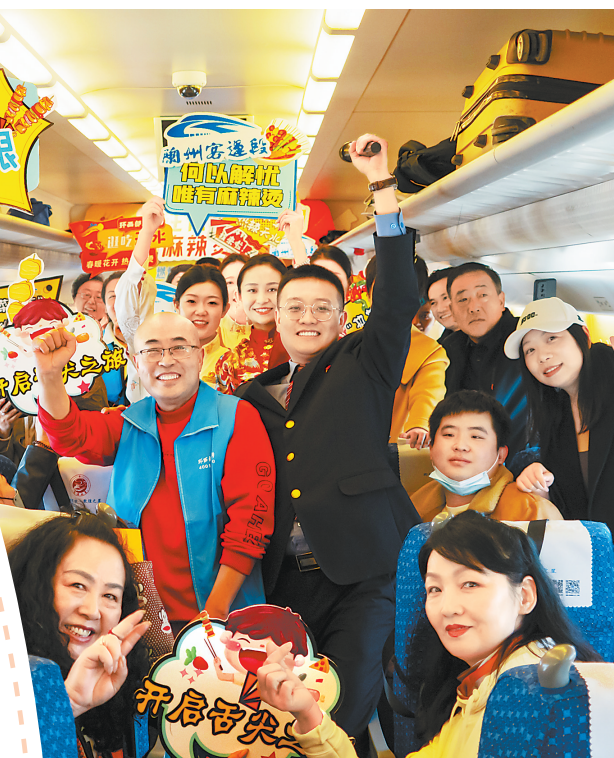
旅客乘坐天水“麻辣烫”专列。 新甘肃·甘肃日报通讯员 宋佳龙