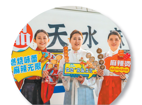
天水“麻辣烫”专列从兰州西站启程。

麻辣烫”旅游品牌，进一步助力天水做强“麻辣烫”品牌，让“小资源”持续释放“大效应”。