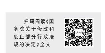
扫码阅读《国务院关于修改和废止部分行政法规的决定》全文

同时,废止煤炭送货办法等13部行政法规,更好地适应当前经济体制变化、改革发展实践需要以及有关领域工作实际,进一步增强法律法规制度的时效性。