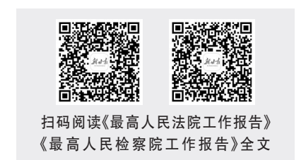
扫码阅读《最高人民法院工作报告》《最高人民检察院工作报告》全文

安排:始终坚持党对检察工作的绝对领导;坚决维护国家安全、社会稳定、人民安宁;依法服务高质量发展这个新时代的硬道理;高效履行法律监督职责;做实人民群众能体验得实惠的检察为民;持之以恒提升法律监督能力。