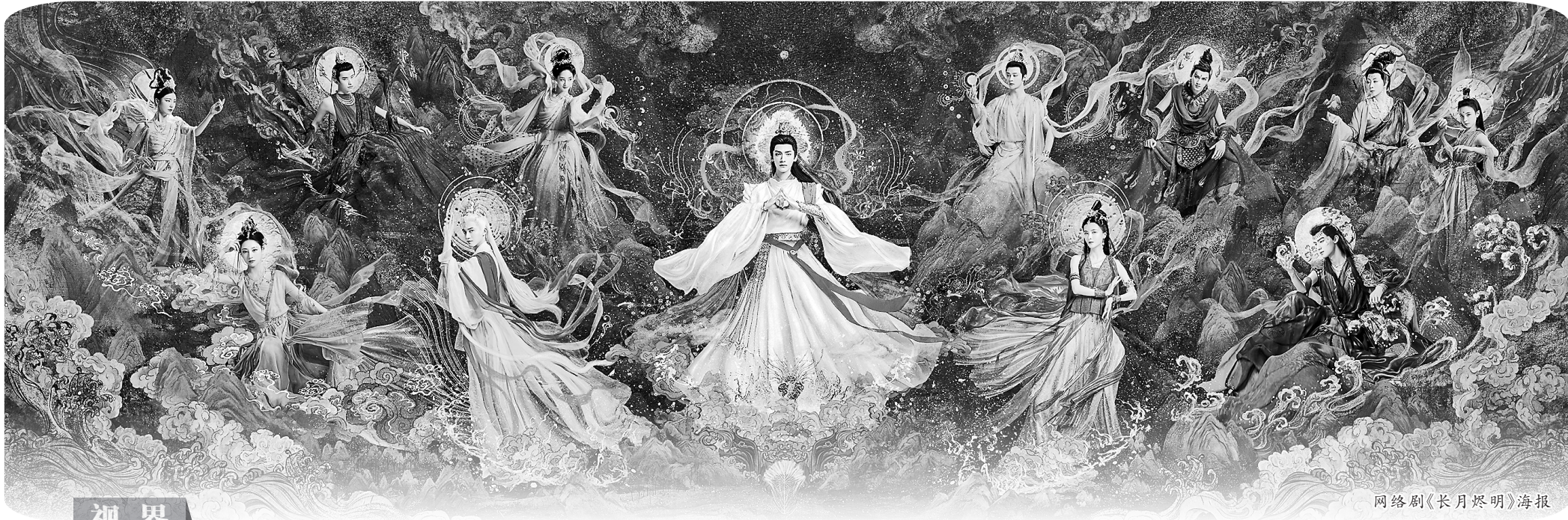
网络剧《长月烬明》海报

荧屏开年红火,大剧续写灿烂新篇,国产剧致力于影视作品类型创作的创新,拓宽着表达边界,为2024年的国产剧营造了良好开局。