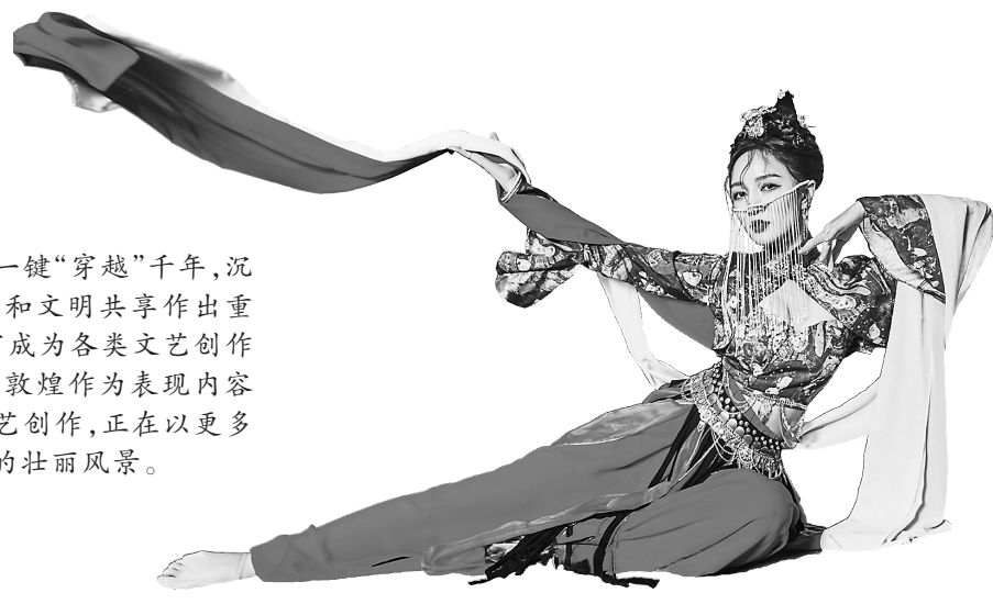
《登场了!敦煌》节目照