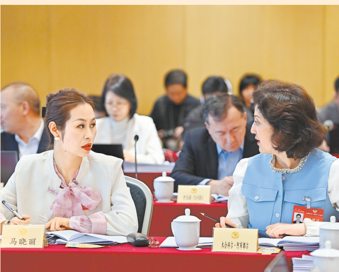
△ 3月8日,出席全国政协十四届二次会议的委员分组讨论“两高”工作报告。