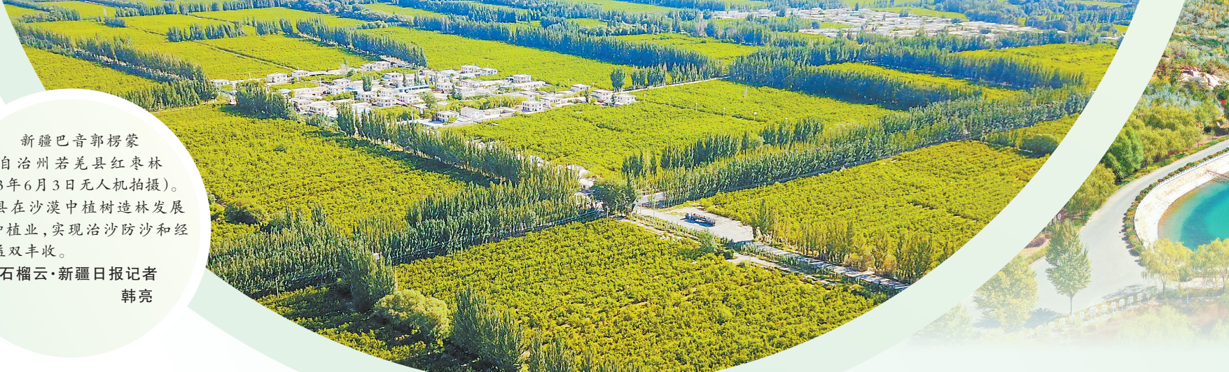
新疆巴音郭楞兵团自治州若羌县红杏林(2023年6月3日无人机拍摄)。若羌县在沙漠中植树造林发展特色种植业,实现治沙防沙和经济效益双赢。

截至2023年年底,甘肃“三北”地区共完成重点区城生态保护和修复项目任务751.59万亩,其中营造林236.48万亩,退化草原修复493.74万亩,荒漠化治理工程固沙21.37万亩。