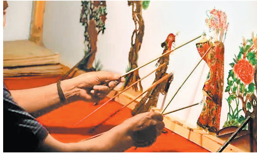
环县道情皮影表演 资料图