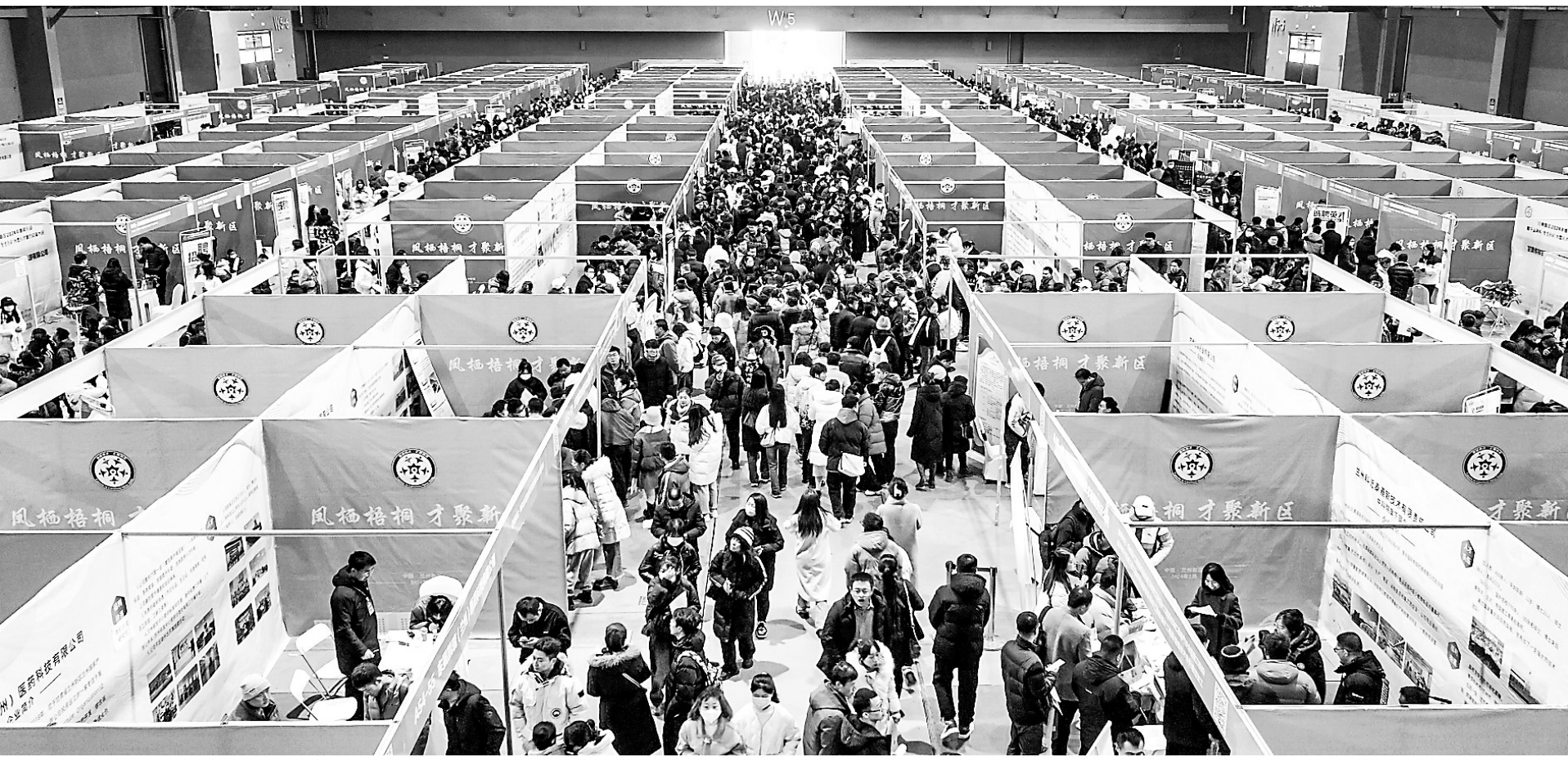
2月24日,兰州新区2024年春风行动暨“产业新城·智享未来”大型人才智力交流大会在丝路绿地国际会展中心举办。

发展信心和生产经营积极性。“工作中还存在哪些困难?”“能不能如期复工?”“安全生产一定要抓好!”春节假期后上班第一天,园区工作人员第一时间来到企业,详细了解复工复产准备情况,现场协调解决面临的困难与问题。金塔县成立工作组,积极走进企业开展调研,落实助企纾困、稳岗稳产等政策,逐个破解复工复产难题,保障企业用工、融资等需求,全力支持企业拼抢订单,抢占市场份额,奋力实现“开门红”。