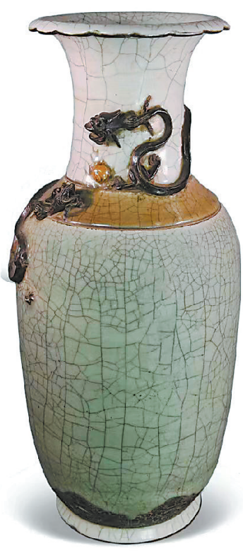
清 二龙戏珠冰裂纹瓷瓶 张家川县博物馆藏