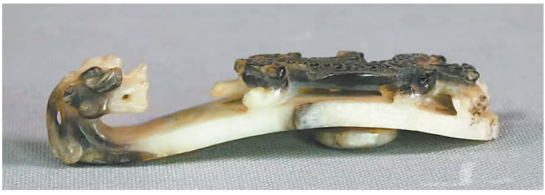
明玉龙钩带 张家川县博物馆藏

在人们心目中,龙是一种吉祥的神物。从远古图腾、十二生肖、民间崇拜、权力象征、文化印记等都有许多与龙相关的表现方式,我国古代的能工巧匠,将龙元素融入各种工艺品的设计制作,妙趣横生,丰富多彩。几千年来,丰富浩繁的龙形象逐渐渗透到人们社会生活的各个方面,成为中华民族的一种文化凝聚和积淀,其形象深入老百姓心里,也成了人们日常生活中最为常见的文化符号。