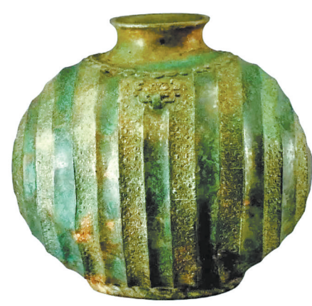
战国 青铜茧形壶 张家川县博物馆藏 (本版图片均为资料图)