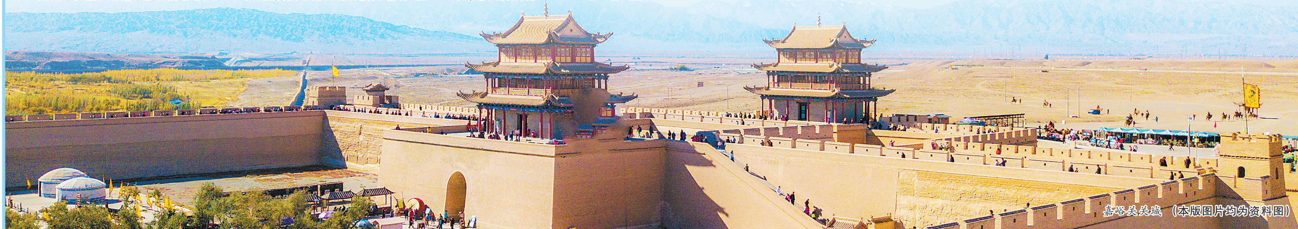
嘉峪关关城

现,表现手段不断丰富,于是在嘉峪关关城里,人们得以看到包括门神及其他装饰性的、丰富的、五彩缤纷的彩画内容。