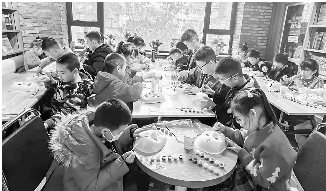
孩子们在绘制脸谱。

通过参加主题活动，孩子们亲身感受到了京剧文化的独特魅力，增长了知识，增强了团结协作意识。陇西路社区相关负责人表示，社区将持续举办此类活动，为辖区青少年提供展现自我、培养兴趣的平台，不断促进社区文化的传承和发展。