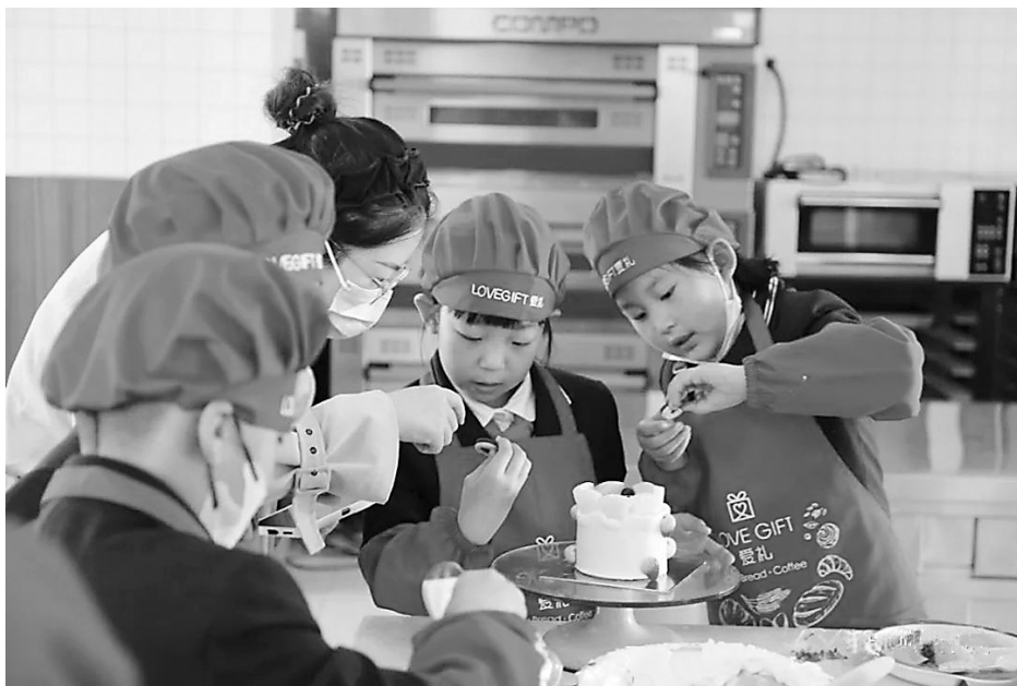
烘焙老师教学生们制作蛋糕，让他们体验食物的来之不易。

焦家湾东社区还举办了“厉行节约，反对浪费”宣传和签名承诺活动。志愿者走上街头，向辖区民众发放宣传资料，号召大家珍惜粮食，践行“光盘行动”，争做文明用餐、节俭消费的倡导者、践行者和示范者。活动不仅吸引了来往的行人和周边商户，也吸引了众多小学生。在以“光盘行动”为主题的手工黏土活动中，工作人员详细介绍黏土的制作方法和制作要点，居民通过揉、搓、捏等步骤完成了一幅幅作品，大家在手工作品上写下了自己的名字和对“光盘行动”的寄语。