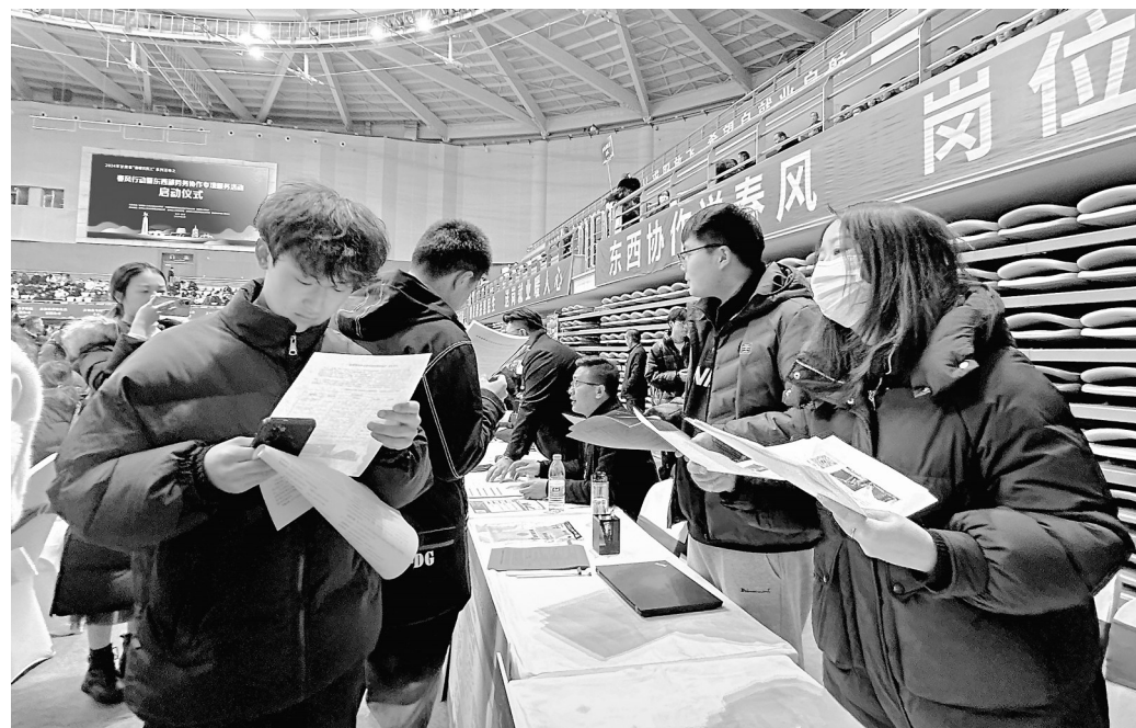
1月30日,在甘肃省春风行动暨东西部劳务协作专项服务活动启动仪式现场,求职者正在咨询工资待遇等信息。

务等行业,现场达成意向性就业协议2100多份。活动期间,武威市主会场、积石山县分会场同步举行了甘肃省“直播带岗”活动,为求职者推介岗位,为323家企业直播推送岗位9300多个,17万余人次在线观看直播。启动仪式结束后,举行“点对点”集中发车仪式,222名务工人员乘包机和火车前往厦门务工。