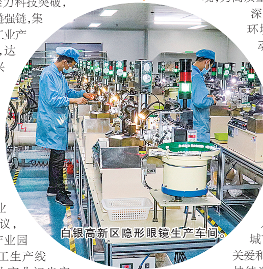
白银高新区隐形眼镜生产车间。

2023年,白银市聚力科技突破,致力产业提质,延链补链强链,集群能级大幅跃升,全市工业产值迈上900亿元台阶,达952.9亿元,战略性新兴产业增加值占规上工业比重达到15%。