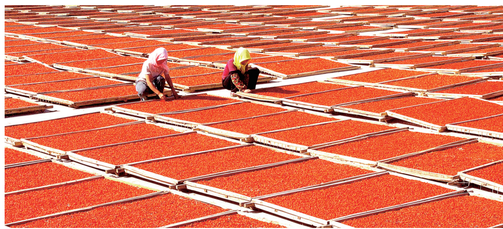
白银枸杞喜获丰收。

乡村振兴重在产业振兴。白银市坚持把乡村产业培育作为推进乡村振兴的核心基础,推动构建形成牛、羊、猪、菜(瓜)四大主导产业集群化发展,文冠果、枸杞、马铃薯、小杂粮四大优势产业片带化发展