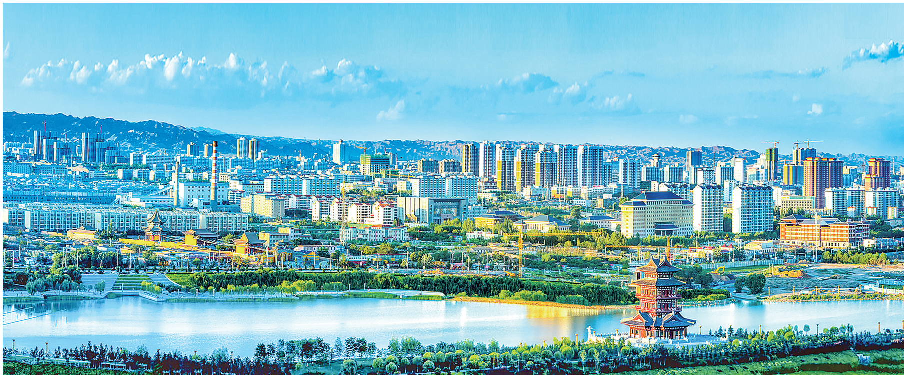
白银市城市建设日新月异。

全年地区生产总值增长7.0%,规上工业增加值增长7.2%,固定资产投资增长13.4%,社会消费品零售总额增长4.7%,一般公共预算收入增长18.4%,城乡居民人均可支配收入分别增长6.1%和8.0%,高质量发展取得新进展新成效。