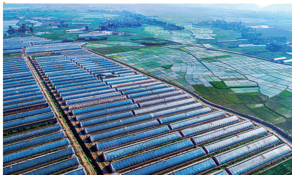
靖远万亩设施蔬菜种植基地。

2023年,白银市接待游客2417.24万人次,增长190.74%,实现旅游综合收入125.86亿元,增长449.66%。