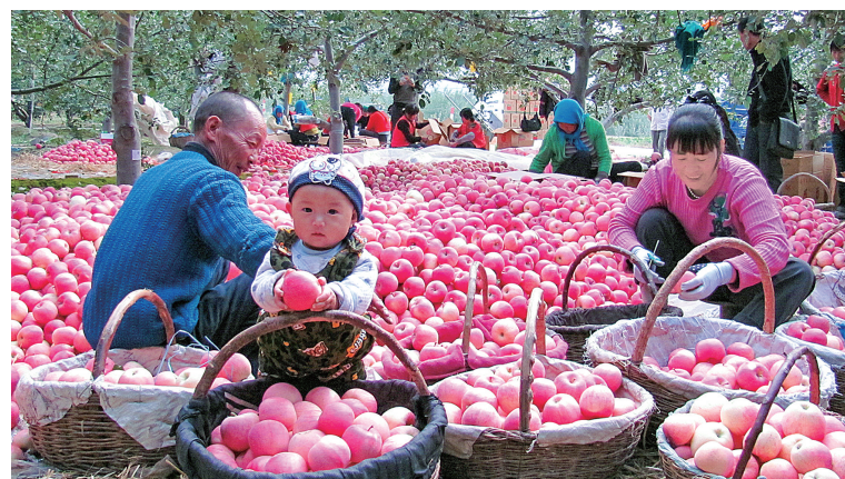
静宁苹果喜获丰收。

着力提高绿色发展水平。在全省率先谋划部署全域创建国家生态文明建设示范区,国家森林城市建设成效持续巩固,实施陇中地区生态保护和修复23.18万亩,完成造林封育22万亩,加快推进产业生态化、生态产业化。30万吨尾料资源综合利用、5万吨全生物可降解塑料制品等项目进展顺利,全市一般工业固体废物综合利用处置率达到83.8%。崇信县被命名为全国第七批“绿水青山就是金山银山”实践创新基地,泾川县、庄浪县荣获“国家水土保持示范县”称号,灵台县荣获“省级国家园林城市”称号。