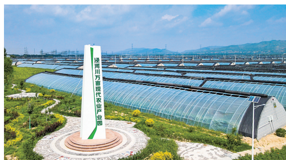
崆峒区泾河川万亩现代农业产业示范园。