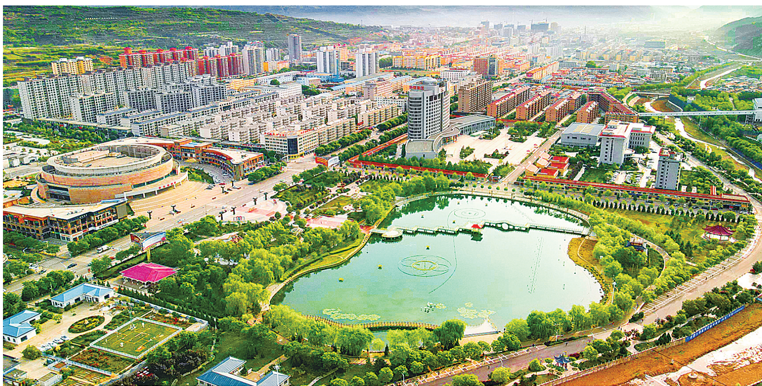
华亭市连续两年蝉联全国新型城镇化质量百强县市。图为华亭城区新貌。