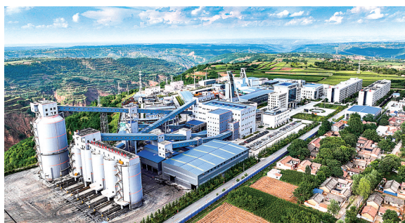
灵台县邵寨煤矿建成投产。