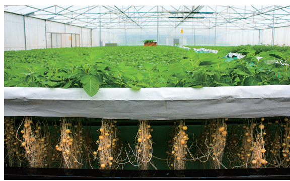
庄浪县雾培法生产马铃薯原种。