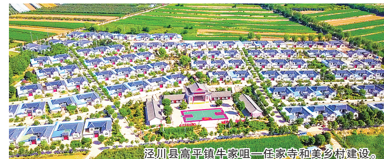
泾川县高平镇牛家咀一任家寺和美乡村建设。

链项目建成,全面完成优势特色产业三年倍增目标。平凉国家农业科技园区通过科技部验收,静宁县、庄浪县纳入国家苹果产业集群项目区,庄浪县纳入国家马铃薯产业集群项目区,静宁县入选全国农业现代化示范区创建名单。“平凉红牛”“静宁苹果”区域公用品牌价值分别达到222.8亿元和180.9亿元。