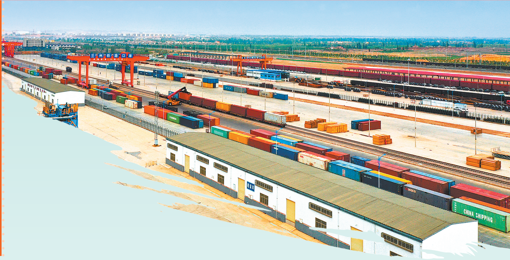
兰州新区铁路口岸,加速建设面向“一带一路”共建国家的多式联运中心和物流集散枢纽。