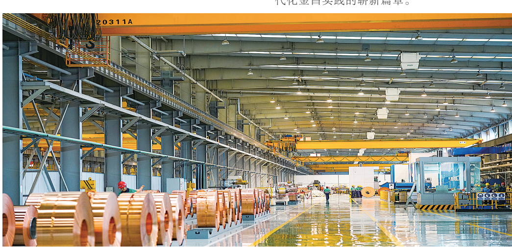
金川集团镍都实业公司高精铜带生产车间。景宝玉