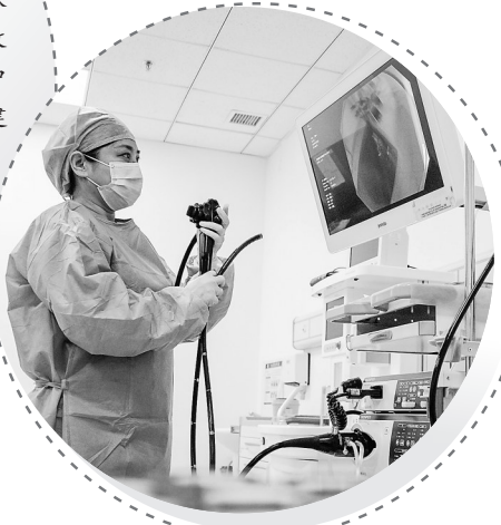
河北省遵化市中医医院的医生在调试设备。

能否打通中医药服务的“最后一公里”,是对示范区建设成效的重要检验。“要让社区成为中医药服务主阵地。”上海市中医药管理局局长闻大翔介绍,全市构建起一张由249家社区卫生服务中心和1986家社区卫生服务站(村卫生室)组成的“家