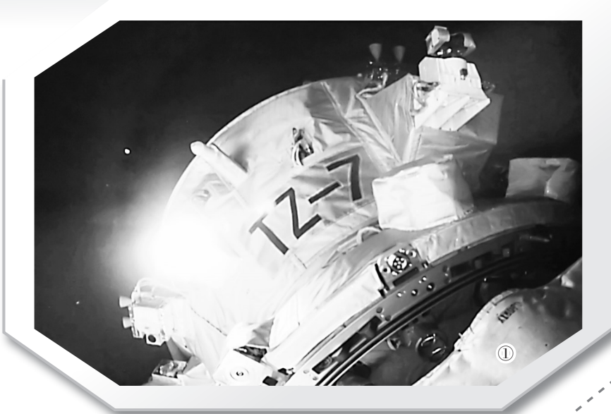
①天舟七号货运飞船与空间站组合体完成交会对接的画面。 ②货运飞船与空间站组合体完成交会对接的模拟图像。 新华社发

尾焰喷薄而出,惊雷般的轰鸣声席卷海天之间,长征七号遥八运载火箭好似蛟龙出海,托举着天舟七号货运飞船,蹈海穿云飞向天宫。