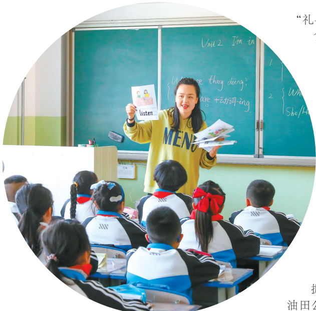
北京科技大学支教团学生在泰安王尹学区授课。