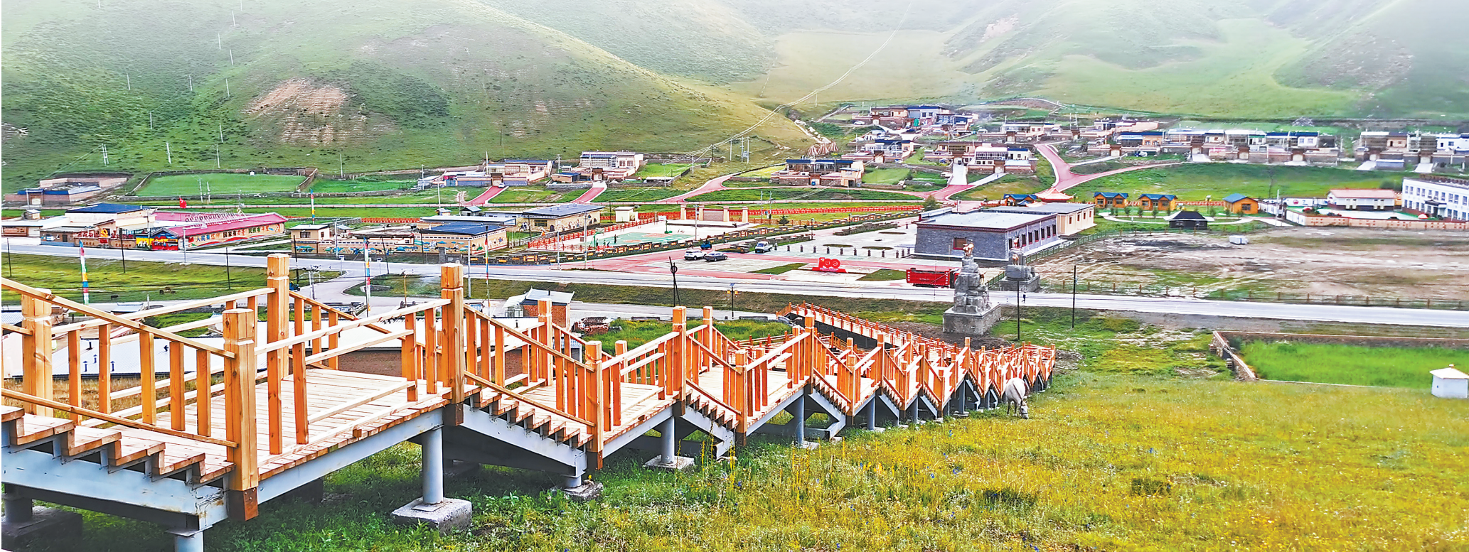
中国海洋石油富岛有限公司援建的合作市勒秀乡麻木奈那生态文明小康村。