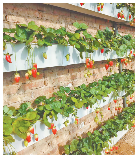
兰沟村温室大棚里的草莓。