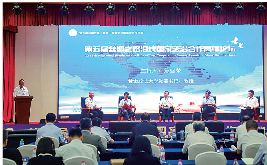
第五届丝绸之路沿线国家法治合作高峰论坛。