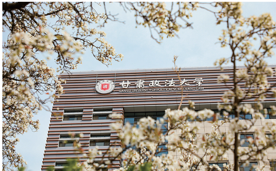
甘肃政法大学安宁校区文翰楼。

星霜荏苒岁序易，华章璀璨新元启。今年是甘肃政法大学开办普通高等教育的第40个年头。新年伊始，中国共产党甘肃政法大学第一次党员代表大会即将召开，掀开学校阔步新时代、奋进新征程的崭新一页。