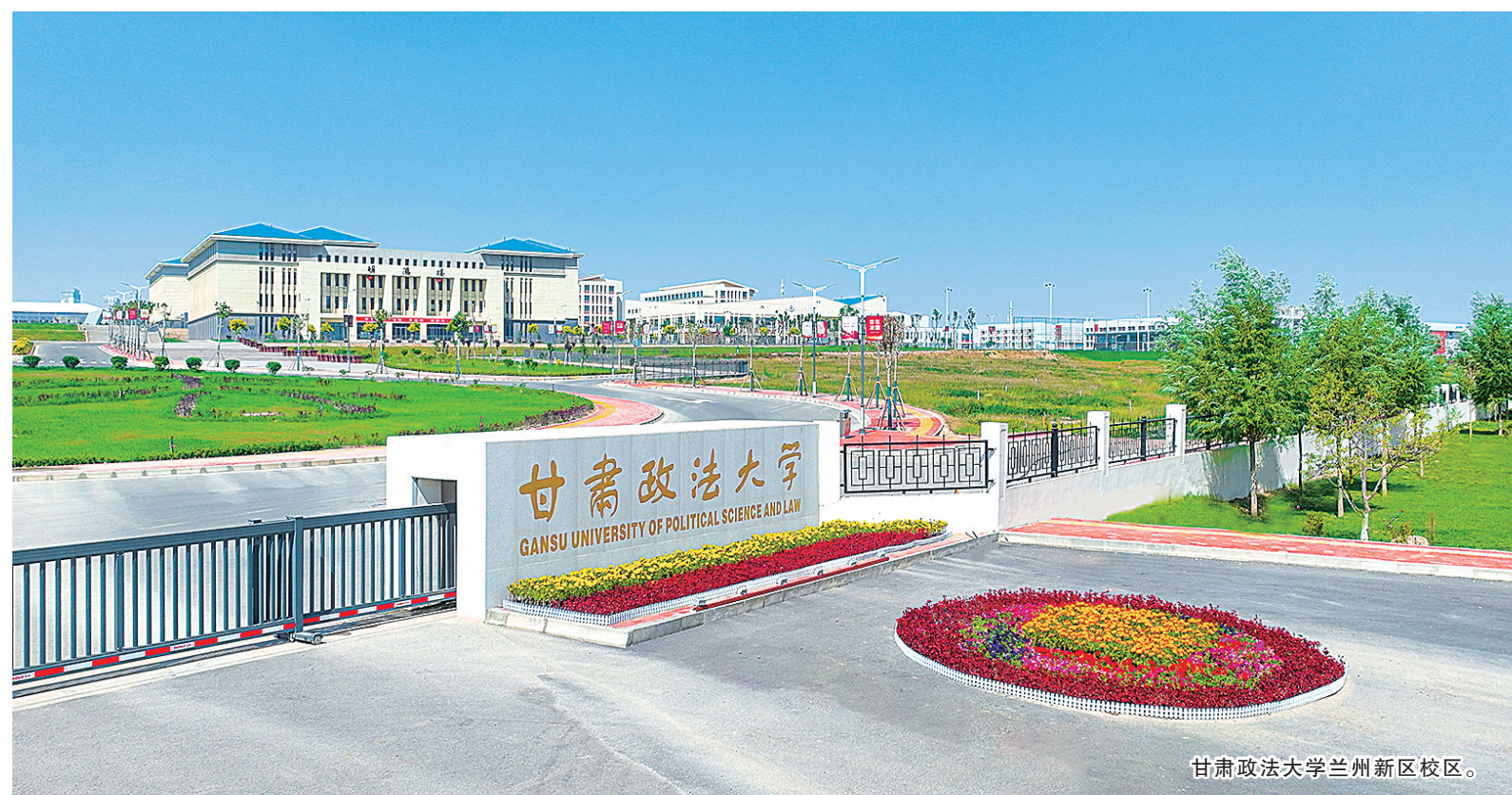
甘肃政法大学兰州新区校区。