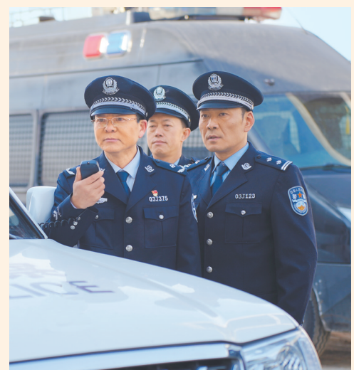
电影《点石成金》剧照