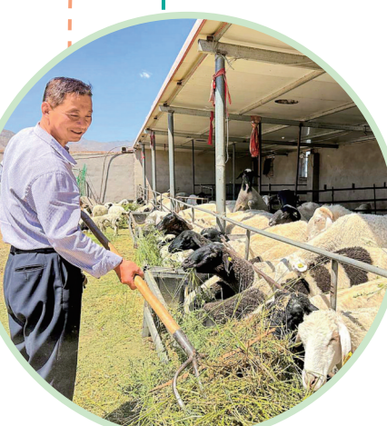
在凉州区金山镇生态及地质灾害避险搬迁安置点配套养殖小区里,村民正在喂羊。