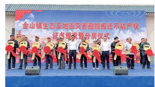
分房仪式上,许多搬迁群众领到了开启幸福生活之门的“金钥匙”。

制定完善村规民约,大力弘扬社会主义核心价值观,充分调动群众参与乡村建设、乡村治理的积极性,努力把金山社区打造成群众满意的暖心社区。组织开展形式多样的群众性文明创建、文体娱乐以及支部共建联创等活动,拉近搬迁群众与当地群众心理距离、感情距离,让搬迁群众团结一心、打成一片、融为一体,迅速融入新生活,切实增强搬迁群众的获得感、幸福感、安全感。