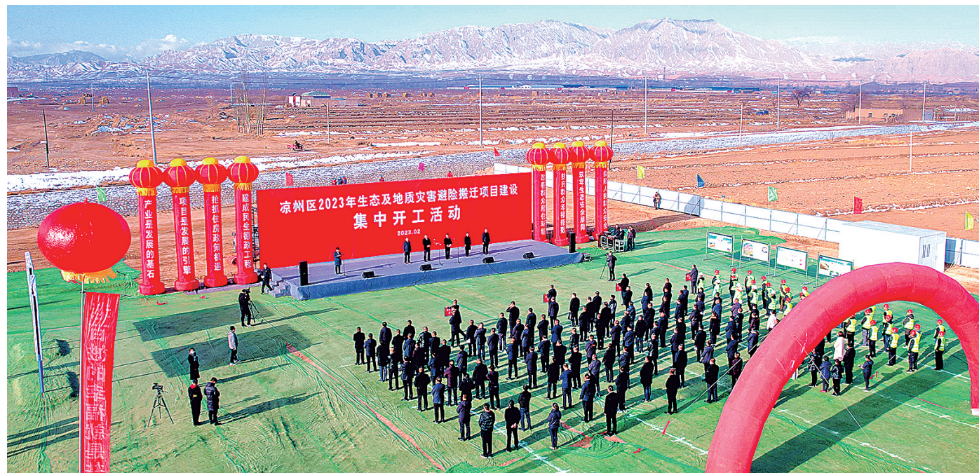
凉州区举行2023年生态及地质灾害避险搬迁项目集中开工活动。金奉乾

实施生态及地质灾害避险搬迁是一项重大民生工程。自生态及地质灾害避险搬迁工作开展以来,凉州区抢抓政策机遇,全面贯彻落实省、市部署要求,聚焦“搬得出、稳得住、有业就、生活好、能融入”和“农村基本具备现代生活条件”的目标,紧扣“抓产业、提风貌、强基础、美环境、保生态”发展思路,因地制宜优化产业布局,分类施策推进乡村建设,坚守底线推进生态文明建设,强基固本提升治理能力,高起点规划、高效率推进、高标准落实,有力有序推进生态及地质灾害避险搬迁各项工作。