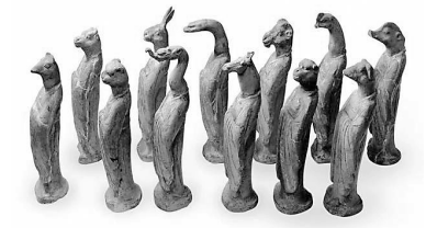
唐十二生肖俑 (甘肃省博物馆藏)