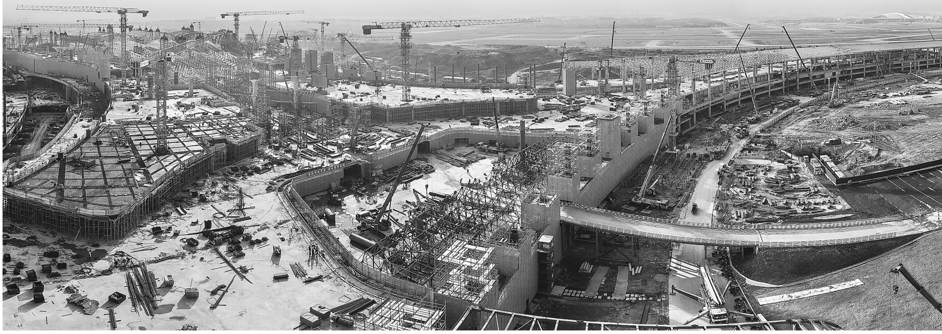
1月4日,广州白云国际机场三期扩建工程T3航站楼项目主楼全面封顶。建成投产后,白云机场年旅客吞吐能力、货邮吞吐能力将分别达到1.2亿人次、380万吨。