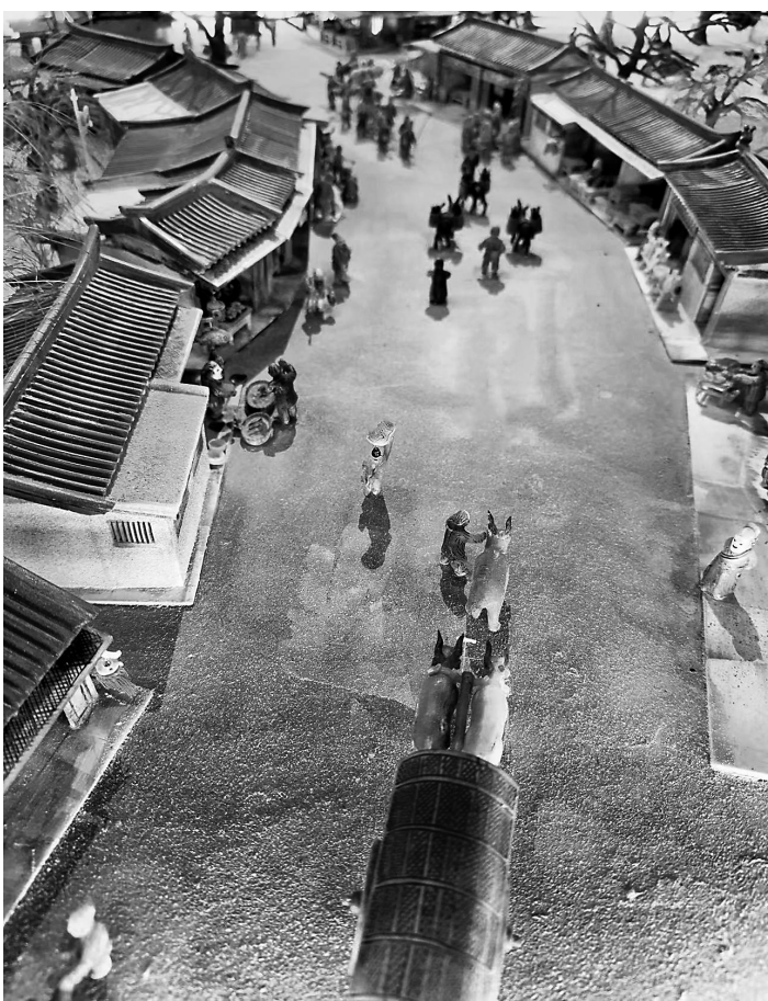
立体微雕“清明上河图”部分场景

近日,由甘肃省文联、甘肃省政协主办的“华彩映视界 珐琅绘敦煌——李海明珐琅艺术作品展”在甘肃艺术馆举行。此次展览汇集了著名珐琅艺术家李海明四十余年的创作成果,展现了他独特的艺