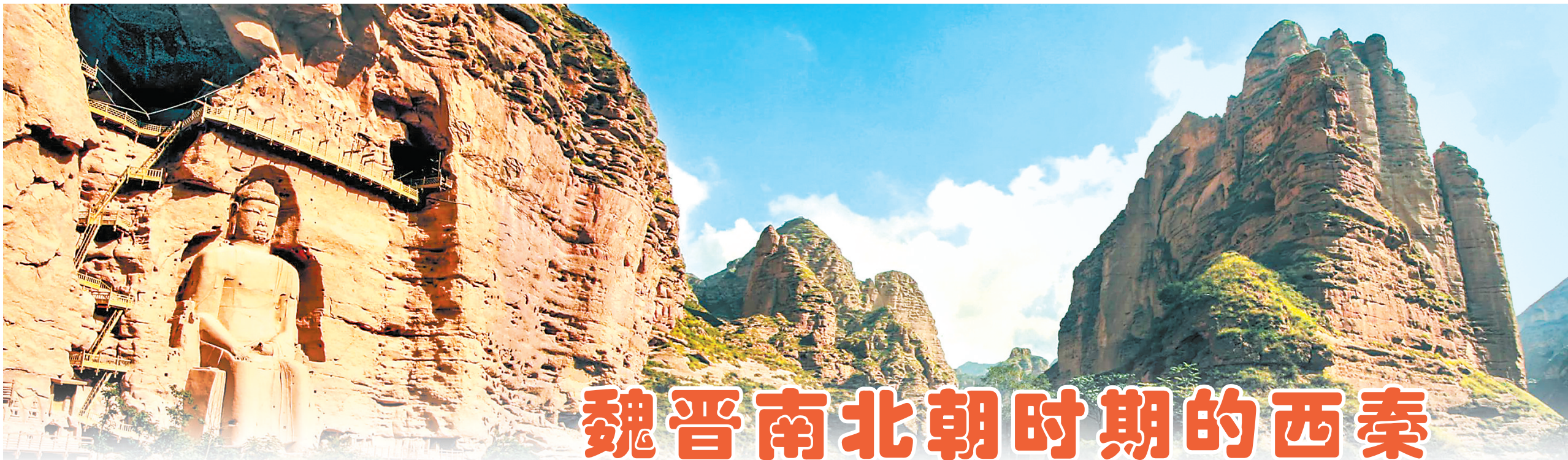
炳灵寺石窟外景 本版图片均为资料图