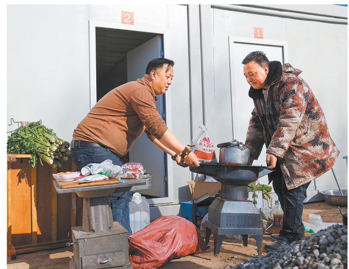
12月24日,在石源村集中安置点,群众正在将生活物品搬入活动板房。

这笔资金重点用于受灾群众应急救助、过渡期转移安置、遇难人员抚恤、倒损住房恢复重建等工作,确保受灾群众得到妥善安置,有地方住、有热饭吃、不挨冻,维护灾区社会稳定、民心安定。