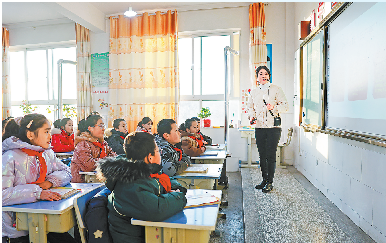
12月25日,积石山县柳沟乡阳山希望小学复课。