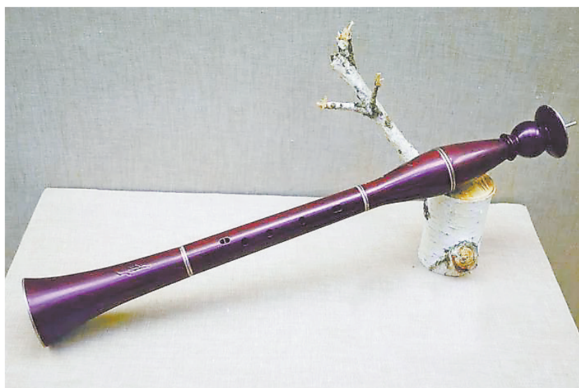
古老的民族乐器：胡笳（资料图）

当下，文化自信成为举国上下形成共识的最持久最深沉的力量，而甘肃人的体会尤为深刻，因为甘肃是一个最热切盼望着复兴的地方，作为陇原大地之子，河西引以为傲的叶舟以其强大的精神身躯扮演了时代的弄潮儿。中国文坛久违了的“西北风”再次强劲地吹起，且大有西进之势，甘肃也由之被这水中一叶小舟带向了高潮，尽管这只是文学的高潮，但任何一个社会的高潮都少不了最鲜活的文学，这和哲学是时代精神的精华并不矛盾。文学中的哲学在施展精华的过程中往往比哲学教科书的高头讲章更令人神往。