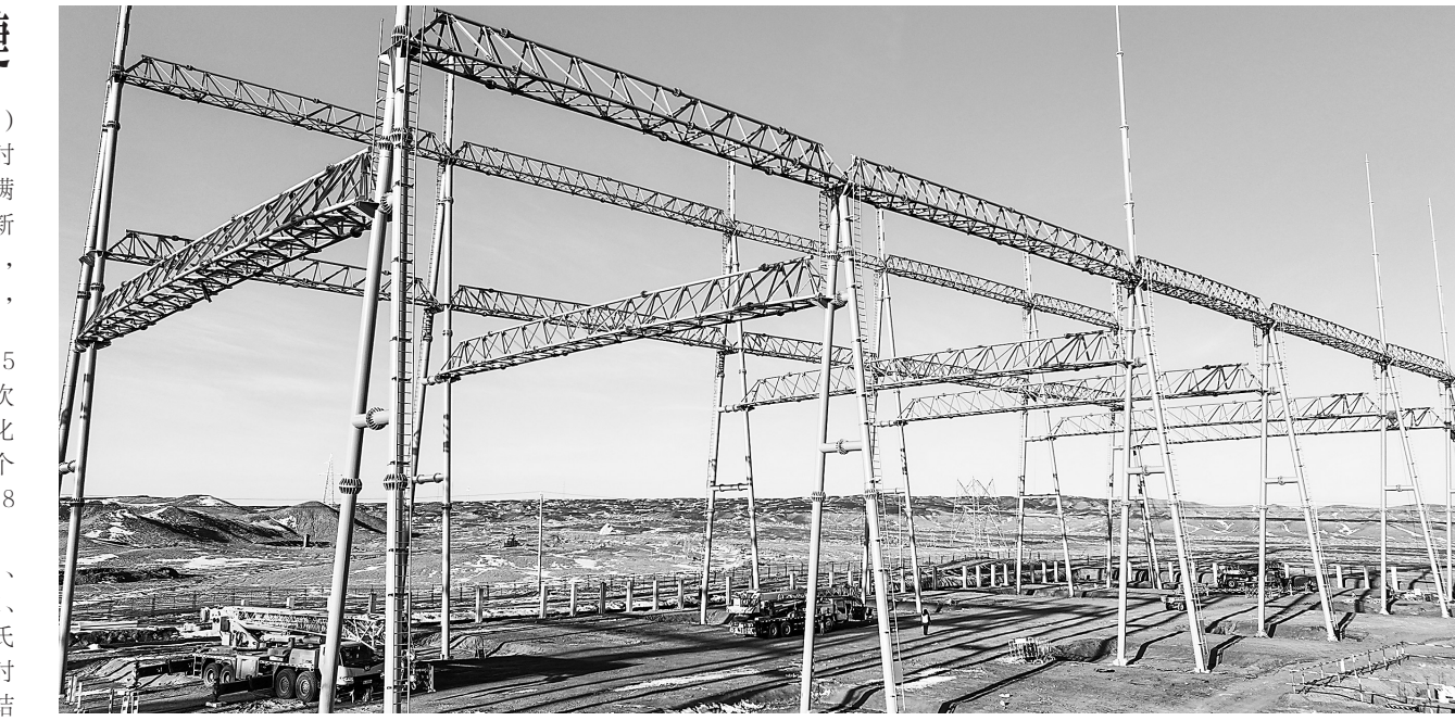
12月21日,随着最后一根钢梁吊装完成,标志着金塔750千伏变电站工程330千伏配电装置区构架吊装工作顺利完成。

据介绍,兰州新区站扩能改造施工工序多、机械配合多、交叉作业人员多、施工组织难度大、安全风险高,400余名参建人员克服零下19摄氏度低温,紧张有序开展既定分配任务,在规定时间内完成了线路拨接和四电工程。随着施工结束,兰州新区站至中川机场站间行车方式由4月18日以来采用的单线行车恢复至双线行车。