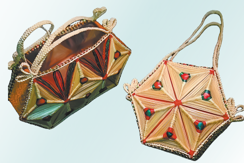
秦安麦秆编作品

一草一木间,一缠一绕中,一物一杰里,憧憬着诗意生活,编织着美好向往。2008年,秦安麦秆编技艺入选第二批甘肃省非物质文化遗产名录。