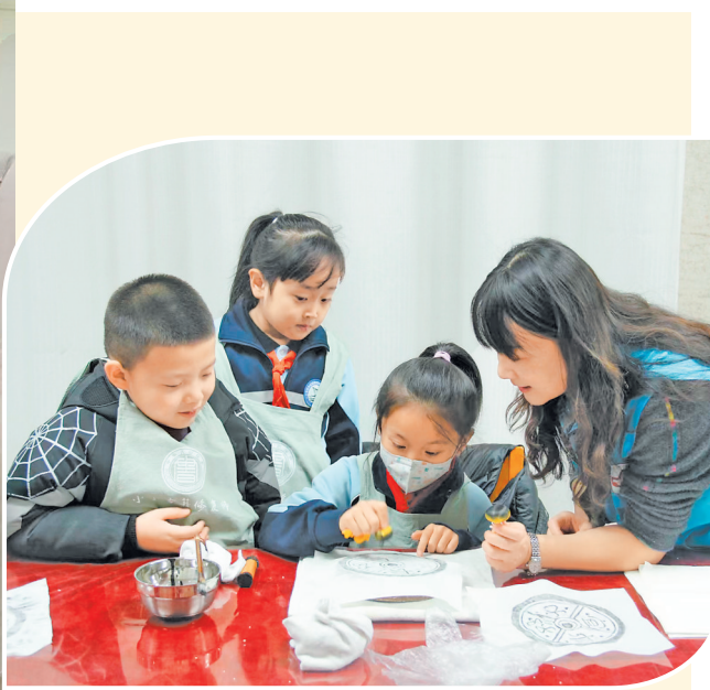
“我是小小古籍修复师”志愿服务活动