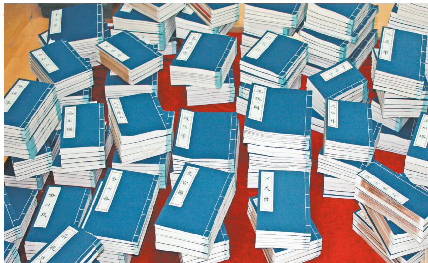
修复后的清末剧本