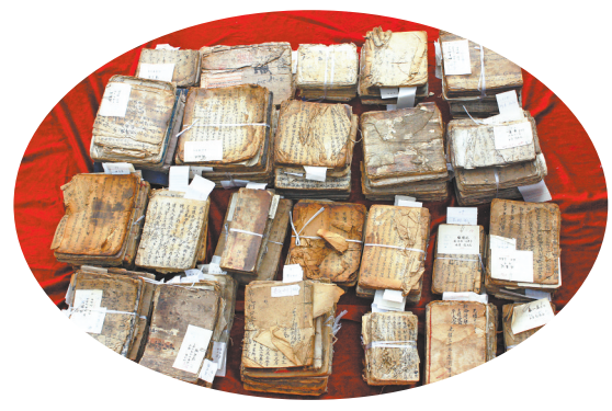
修复前的清末剧本

去博物馆参观,看着展柜中上百年、上千年的破损书画,你又是是否会联想将由谁去修复?