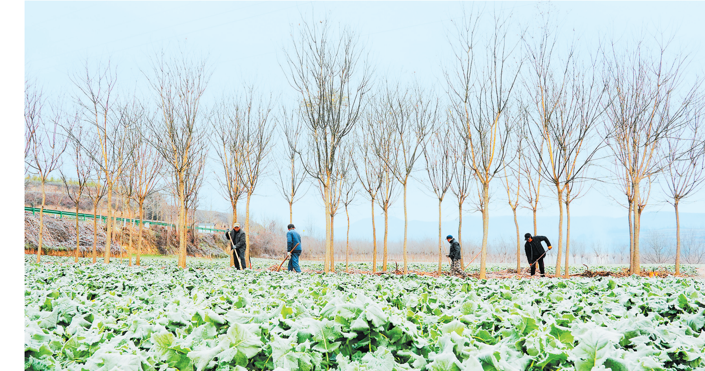
临近冬至气温骤降,徽县永宁镇岳王村农民正抢抓农时翻整土地。 新甘肃·甘肃日报通讯员 高琼

本报阿克苏讯(新甘肃·甘肃日报记者苏家英)12月19日,西北师范大学新疆阿克苏地区实习支教十五周年纪念大会暨“西部边疆地区教师教育创新实验区”揭牌仪式在新疆阿克苏地区举行。大会对近15年以来在新疆阿克苏地区实习支教工作中表现优秀的实习生、指导教师和工作人员等一批优秀典型给予表彰,为“铸牢中华民族共同体意识学校教育研究基地”10所学校授牌,并为“西部边疆地区教师教育创新实验区”揭牌。西北师范大学负责人介绍,2008年,西北师范大学与新疆维吾尔自治区教育厅签署共建基础教育、民族教育创新实验区协议和实习支教工作协议,该校成为疆外第一所援疆支教的师范大学,率先开启援疆实习支教新征程。探索创新了一整套“大学—政府—中小学(幼儿园)”援疆实习支教工作新机制,建立了由“指导教师—支教地区教育行政干部—支教学校教师—支教同学”组成的实习支教共同体,探索形成了集“培养、研究、实验、示范”为一体、适应边疆民族地区实际的实习支教模式。