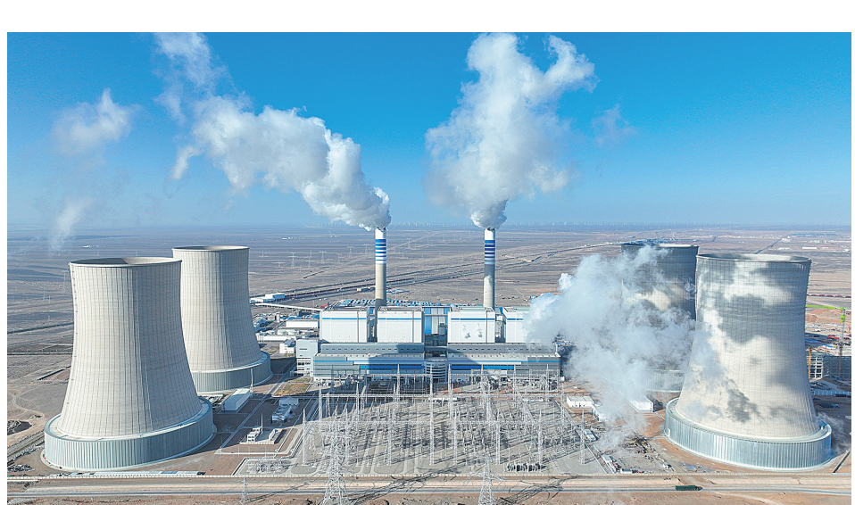
甘肃电投常乐电厂。

12月17日8时30分,中国能建华北院总承包的甘肃电投常乐电厂4号机组圆满完成168小时满负荷试运行,机组各项性能指标整体优良,实现了年内3号、4号机组双机投产。4号机组的正式投产,为支撑河西及华中地区的电力安全保障供应注入了强劲动力。