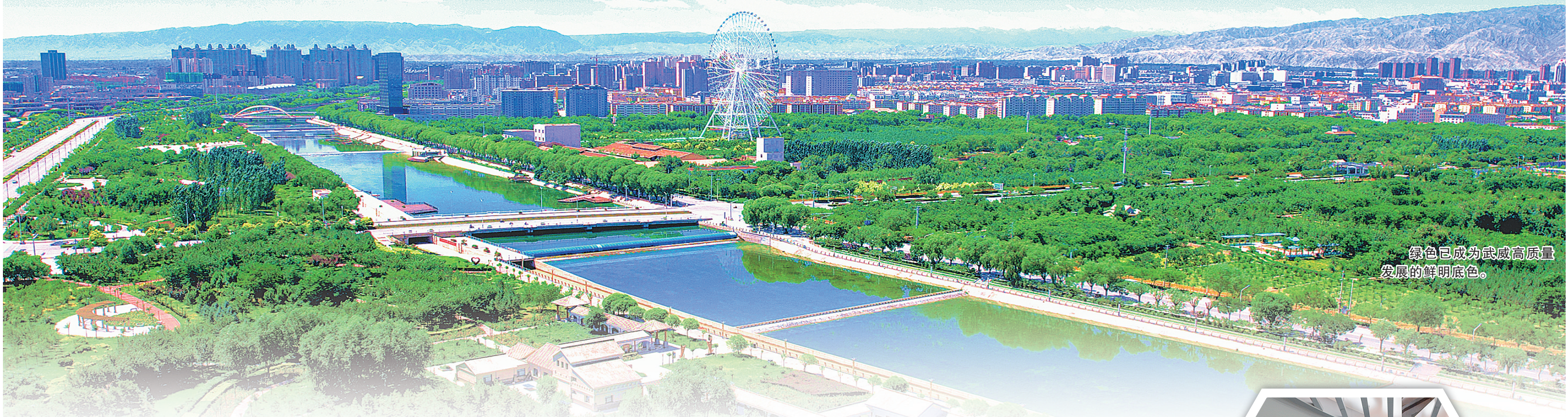
绿色已成为武威高质量发展的鲜明底色。