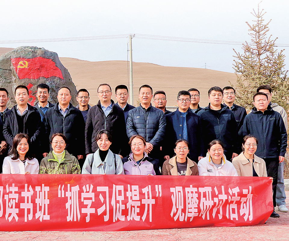
市纪委监委年轻干部读书班“抓学习促提升”观摩研讨活动