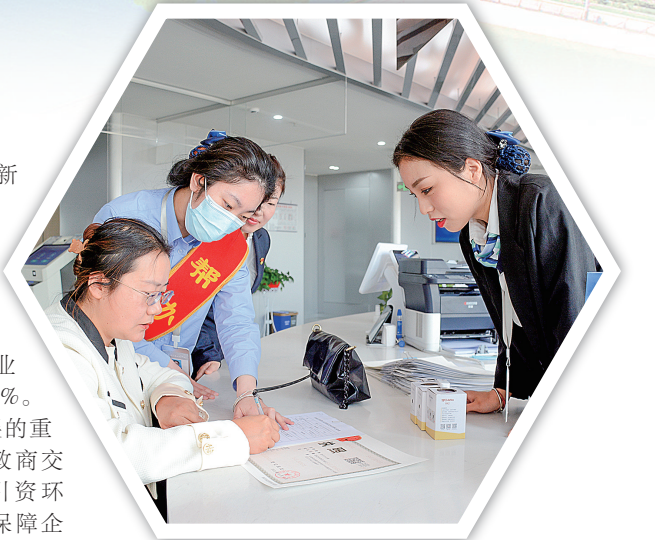
武威市持续优化政务服务,打造一流营商环境。

能源、特变电工、金风科技为链主的新能源装备制造产业链、供应链集群加速崛起。以有力监督助推科技自立自强走在前,切实将督部署与推进度、督结果与巩固贯通起来,推动科技部门在科技创新中彰显担当。今年,全市认定省级科技创新型企业47家,综合科技进步水平指数达到52%。 优化营商环境是推动高质量发展的重要载体。市纪委监委制定《武威市政商交往行为指引清单》,围绕改善招商引资环境、减轻企业负担、优化政务服务、保障企业合法权益等内容建立正面清单12条、负面清单15条,厘清党政机关及其工作人员与企业及其经营者交往边界,规范政商交往行为,打造了亲而有度、清而有为的营商环境。