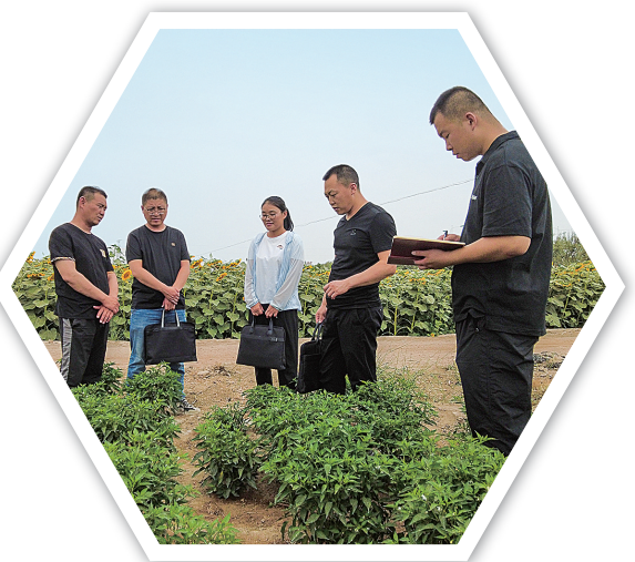
民勤县纪委监委会同镇纪委在三雷镇建新村农田示范点监督检查。

扎实推进“三抓三促”行动,建立健全分析研判、协商会办、领导包案、提级办理、督查督办、定期通报六项工作机制,重拳整治“官本位”“庸懒散”“七不为”等问题,推动全市上下改作风、抓落实、促发展。紧盯全省“优化营商环境攻坚突破年”行动、重大项目“百日攻坚”等开展集中督查,发现并督促整改问题161个。坚持接诉即办,及时受理处置社会监督意见637件,推动解决群众急难愁盼问题376个,清欠企业账款3706.74万元。聚焦招商引资、助企纾困、民生保障等重点任务,靶向纠治“空、庸、推、拖、躲、假、虚、僵”八类问题,查处形式主义官僚主义问题52件135人,推动党员干部真抓实干,奋力开创各项工作新局面。 协助市委制定出台《中共武威市委关于大力推进“干部敢为、地方敢闯、企业敢干、群众敢首创”努力推动高质量发展走在前在先在的意见》《武威市鼓励干部干事创业容错免责八措施》,严格落实“三个区分开来”要求,积极营造鼓励担当、宽容失误的浓厚氛围,提振干事创业的精气神。今年以来,澄清诬告和不实举报409件次,对36名党员干部予以容错免责。