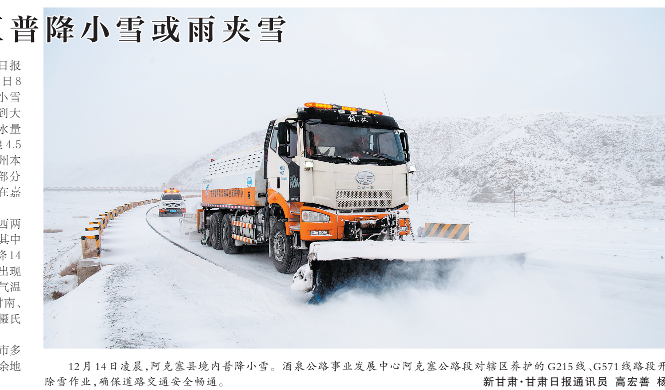
12月14日凌晨,阿克塞县境内普降小雪。酒泉公路事业发展中心阿克塞公路段对辖区养护的G215线、G571线路段开展打冰除雪作业,确保道路交通安全畅通。

本报兰州12月15日讯(新甘肃·甘肃日报记者海晓宁)记者今日从省气象局获悉,14日8时至15日8时,全省共计59个县区出现小雪(雨)或雨夹雪,其中河西沿山地区出现中到大雪,临夏南部、定西北部出现中雪。较大降水量出现在:民乐5.0毫米、古浪4.7毫米、敦煌4.5毫米、肃南3.7毫米、嘉峪关市3.6毫米。兰州本站降水0.3毫米。河西大部、陇中及陇东部分地方有积雪,较大积雪深度为5厘米,出现在嘉峪关市、定西市临洮县。 受强冷空气影响,河西地区及临夏、定西两市局部地方最低气温下降8至12摄氏度,其中酒泉市西部及南部、张掖市南部最低气温下降14摄氏度以上,48小时最大降幅15.9摄氏度,出现在肃北。除河东偏南地区外,全省大部最低气温低于零下10摄氏度,河西五市大部及临夏、甘南、定西三州市局部地方最低气温低于零下15摄氏度,最低气温出现在马鬃山零下24.5摄氏度。 15日白天到夜间,甘南、陇南、天水三州市多云,局部地方阴有小雪(雨)或雨夹雪,省内其余地方多云转晴。