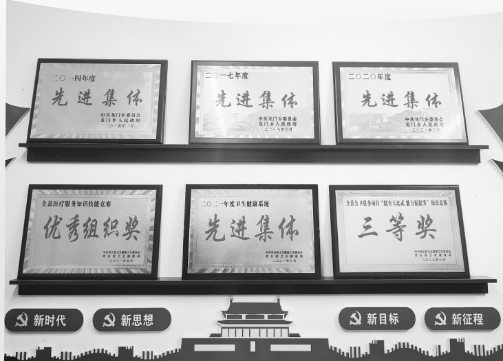
杨安福办公室里的荣誉墙。