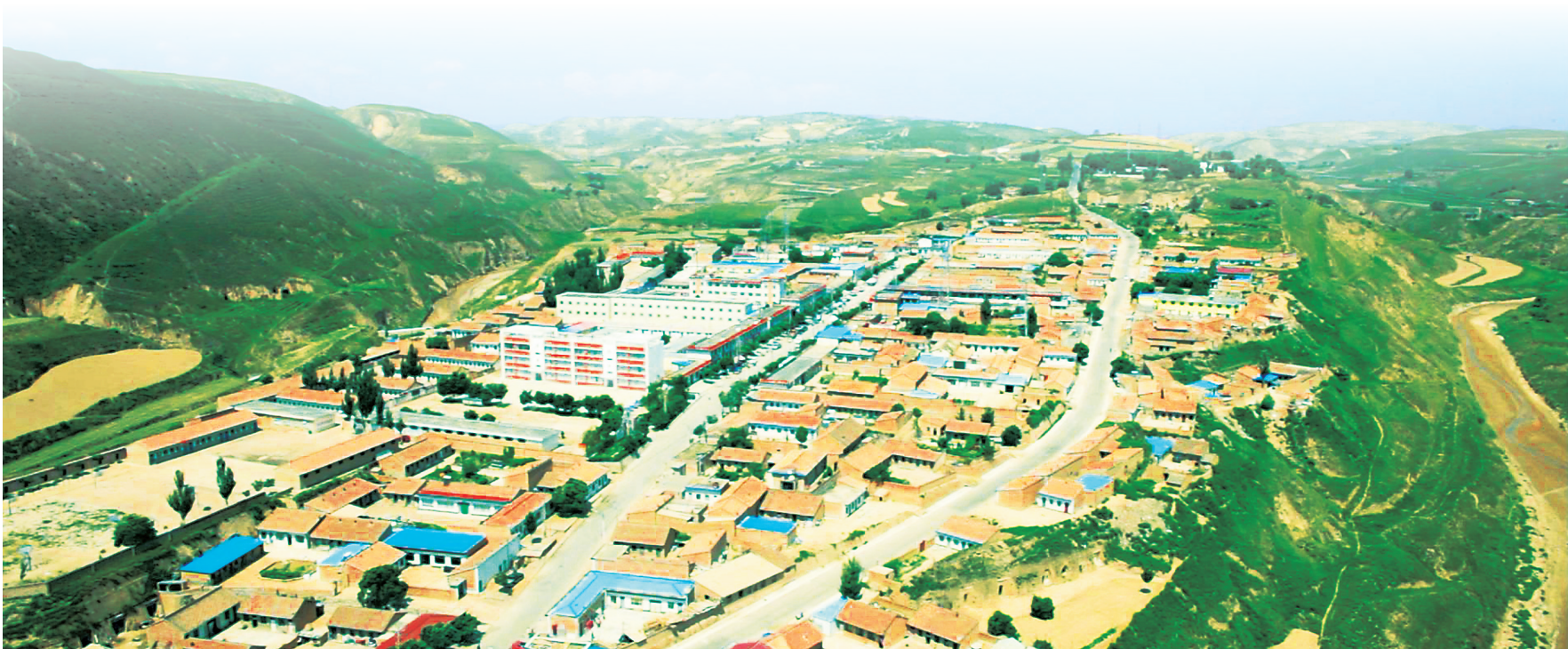
环县山城堡乡全景(本版图片均为资料图)