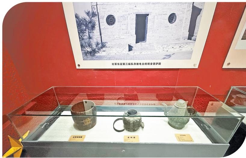
山城堡战役纪念馆陈列的展品