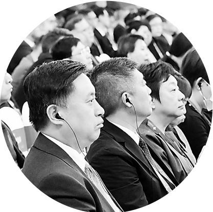
中外与会嘉宾在博览会开幕式现场聆听主旨演讲。

链博会是中国维护全球产业链供应链安全稳定的主动担当。当前，世界经济复苏艰难，因疫情冲击、地缘政治扰动和逆全球化思潮涌动，全球产业链区域化、本土化、短链化发展趋势明显，“断链”“脱钩”风险持续攀升，维护产业链供应链韧性和稳定的要求更加迫切；另一方面，新一轮科技革命和产业变革持续演进，全球产业链供应链朝着智能化、绿色