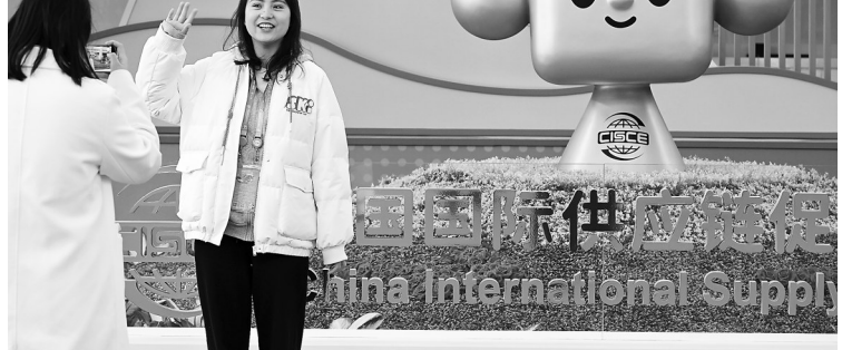
11月29日，参观者在摆放着“链氢”标识的花坛前留影。