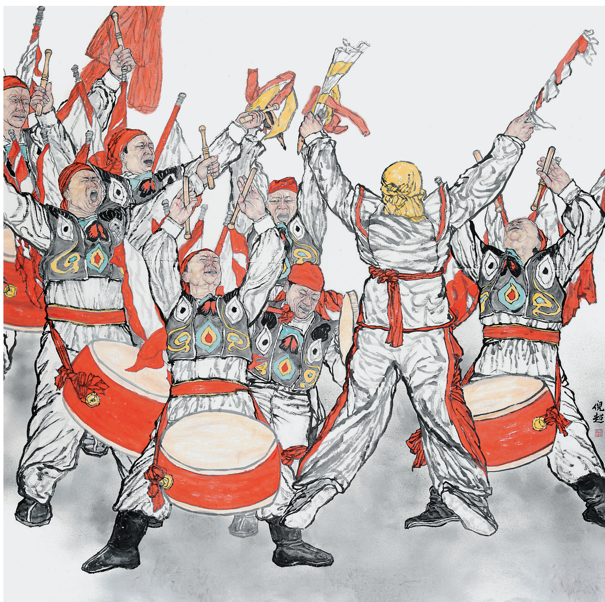
黄河鼓韵(中国画)倪超