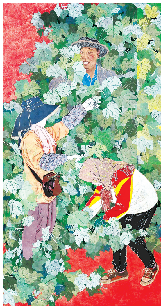
致富路上(中国画)徐秀丽