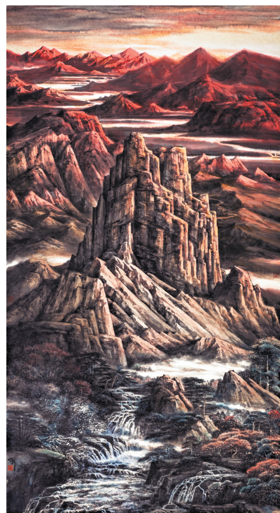
大河之源(中国画)王峻