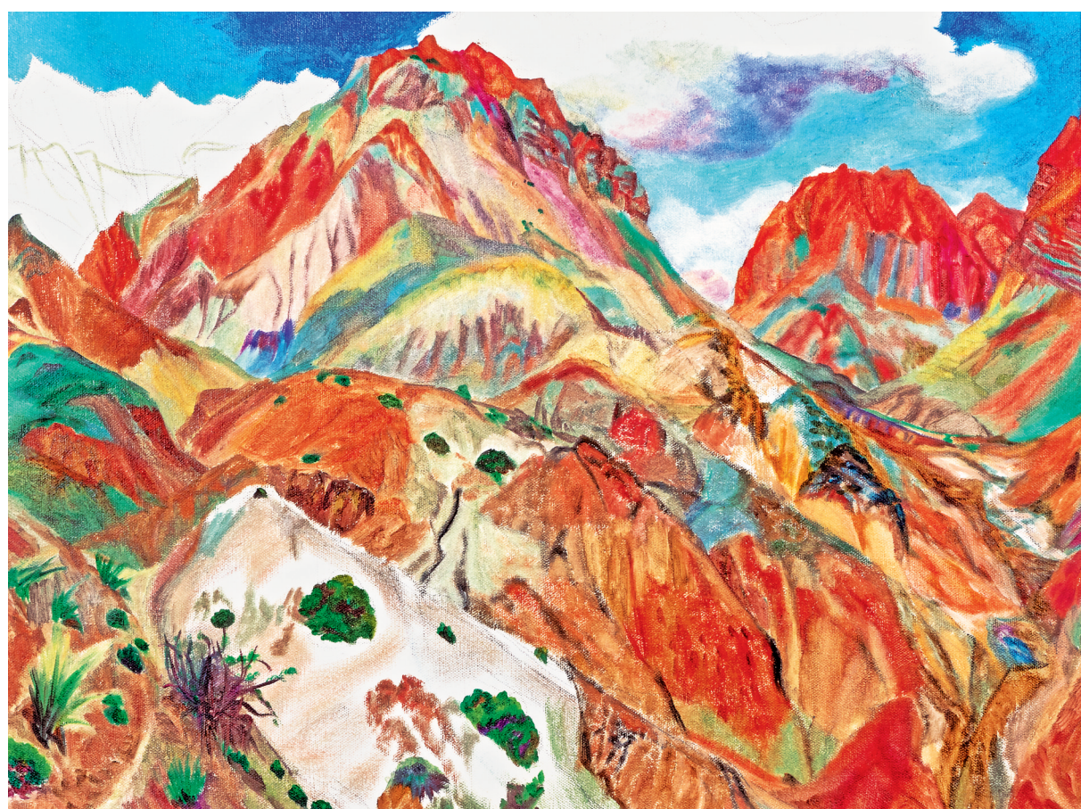
黄河岸边(油画)张金凤