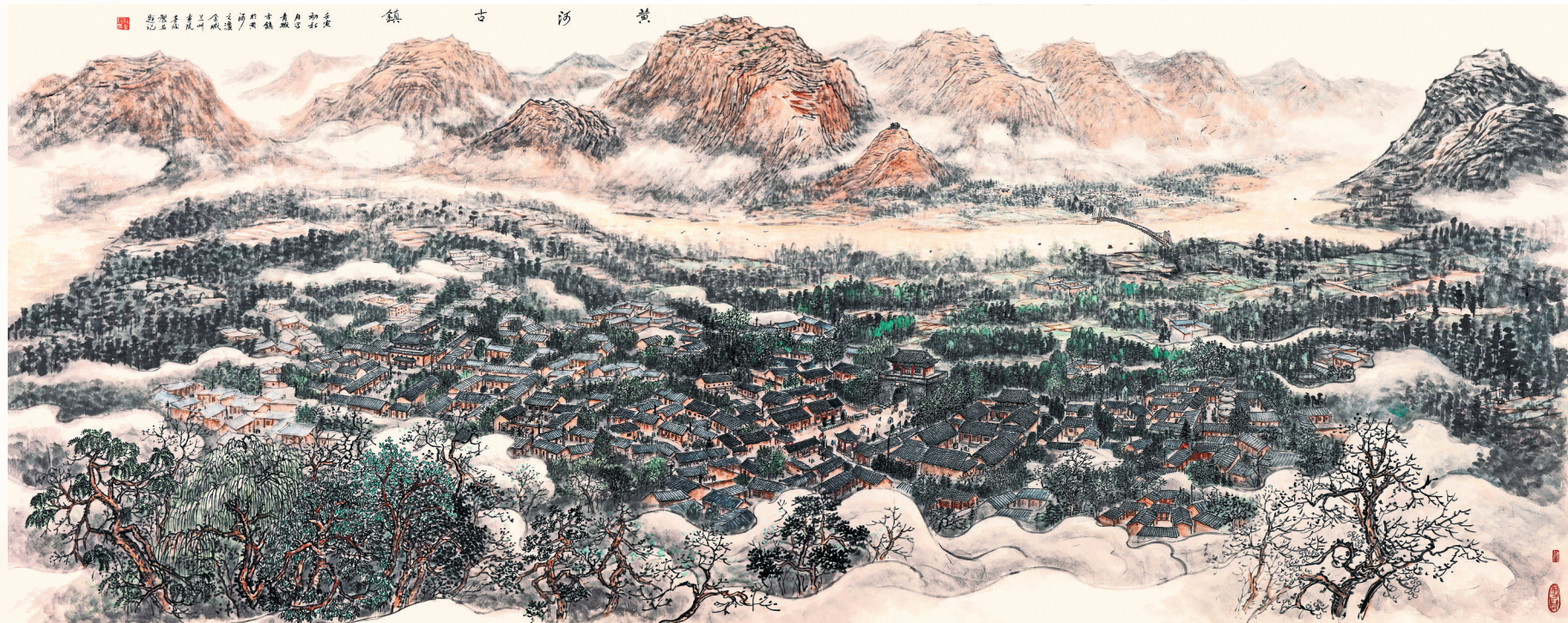
黄河古镇(中国画)杜喜俊

黄河万里,气象万千。黄河发源于青海,成河于甘肃,经九省(区),滚滚向东入渤海。这条大河,百川汇合,千古流淌,生发了灿烂夺目的黄河文化,滋养了一代代炎黄百姓。