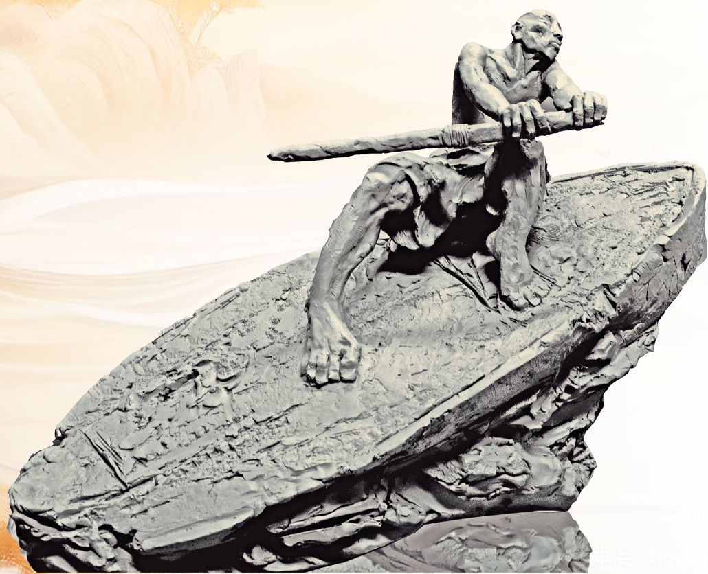
遥远的记忆(雕塑)付鹏涛