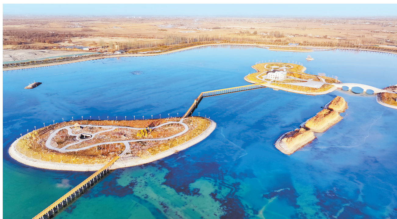
冬日里的临泽县曹家湖生态园风景如画。近年来,临泽县建成河湖相连、水质优良的水系连通系统,为乡村振兴注入源头活水。

受理期间:2023年11月22日—12月22日 受理电话:0931—8920182 邮政信箱:甘肃省兰州市A338号邮政信箱 受理时间:每天8:00—20:00