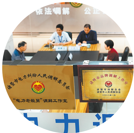
在浙江诸暨电力综治中心电力调解室,“电力老娘舅”调解员在为群众进行调解(2023年5月26日摄)。