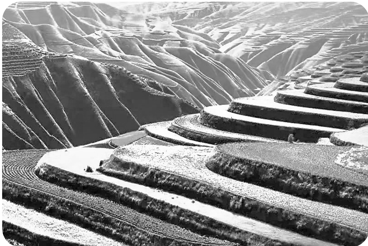
西北抗日义勇军诞生地榆中县园子岔今貌

在红四方面军长征队伍中有一支妇女独立团,简称妇女团。1936年10月,红军三军会宁大会师后,红四方面军总部将其中的精壮者1300余人编为中国工农红军妇女抗日先锋队,辖3个营,9个连,王