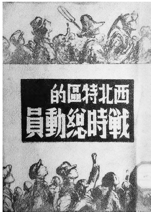
抗战初期的出版物《西北特区的战时总动员》(甘肃省博物馆藏)

地处六盘山区的海(原)固(原)地区(原属甘肃省,现属宁夏回族自治区管辖),1939年到1941年间,这里先后爆发了三次回族群众自发反抗国民党残酷压榨的武装起义。前两次起义都先后被国民党分化瓦解。1941年5月,马思