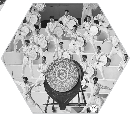
开放发展的新定位,更是酣畅展现青春山水、壮美广西、大美中国。