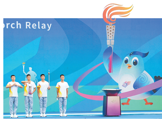
10月19日拍摄的火炬传递启动仪式现场。当日,杭州第4届亚洲残疾人运动会火炬传递在淳安县千岛湖秀水广场启动,进行首日传递。